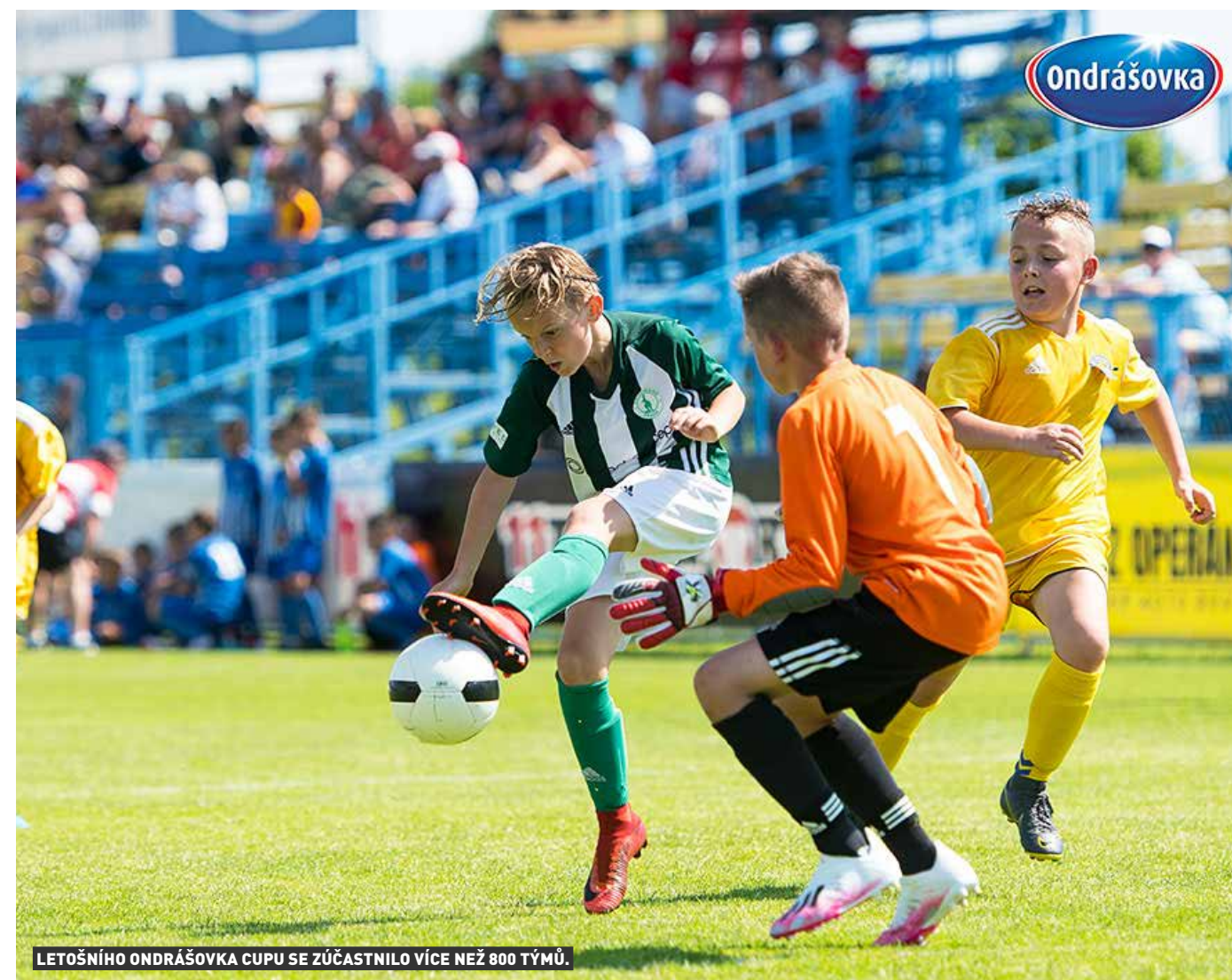
LETOŠNÍHO ONDRÁŠOVKA CUPU SE ZÚČASTNILO VÍCE NEŽ 800 TÝMŮ.

Závěr letošního Ondrášovka Cupu, který je oficiálním Pohárem mládeže FAČR, obstaraly v Benešově finálové turnaje kategorií U8 a U11. Nejprve se odehrál turnaj nejmladší kategorie, v níž se z poháru pro vítěze radovali malí fotbalisté 1. FK Příbram, kteří za sebou nechali na dalších medailových pozicích slavné pražské kluby Slavii a Spartu. V kategorii U11, která seriál finálových turnajů uzavřela, dosáhla na jediný letošní titul v Ondrášovka Cup Slavia Praha před svým odvěkým rivalem Spartou a Pardubicemi.