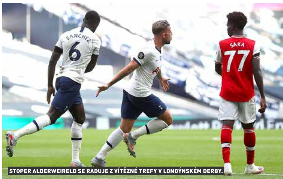
STOPER ALDERWEIRELD SE RADUJE Z VÍTĚZNÉ TREFY V LONDÝNSKÉM DERBY.

Sobotní záchranářská bitva v Norwichi dopadla pro domácí Kanárky katastrofálně, po vysoké porážce 0:4 s West Hamem definitivně přišli o naději na udržení a stali se prvním sestupujícím z Premier League. Víkendový program okořenilo severolondýnské derby, které nakonec ovládl Mourinhov Tottenham.