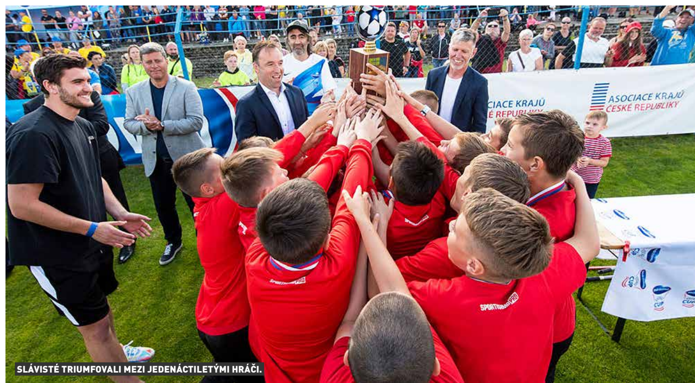
SLÁVISTÉ TRIUMFOVALI MEZI JEDENÁCTILETÝMI HRÁČI.

našeho fotbalu. Všechno začíná od rodičů, i když jejich ambice jsou někdy příliš velké. Hlavní je ale ten kluk. Jestli chce fotbal hrát a dává mu všechno, tak se může posunout dál. Poslední roky se náš fotbal nasměroval správným směrem. Chodím na fotbal se svým vnukem, a podle toho, co vidím, tak nemám o budoucnost našeho fotbalu strach,” zhodnotil Ondrášovka Cup i stav českého mládežnického fotbalu kouč národního mužstva Jaroslav Šilhavý.