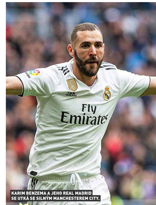
KARIM BENZEMA A JEHO REAL MADRID SE UTKÁ SE SILNÝM MANCHESTEREM CITY.

O účastnících „Final Eight“ se teprve rozhodne po dohrání osmifinálové fáze. Pokud Manchester United vyřadí Linec, narazí na Kodaň, nebo Basaksehir, vítěz souboje Inter Milán - Getafe vyzve Leverkusen, či Glasgow Rangers. Zbývající čtvrtfinálovou dvojici vytvoří postupující z utkání Šachtar Doněck - Wolfsburg a Basilej - Frankfurt. Dvě dvojice Inter Milán - Getafe a Sevilla - AS Řím osmifinále před koronavirovou přestávkou nestihly rozehrát a UEFA rozhodla, že se v Německu utkají v jednom zápase. Ostatní kluby mohou osmifinálové odvetu rovněž ve dnech 5. a 6. srpna absolvovat na svých stadionech. Utkání se podle očekávání uskuteční bez diváků na tribunách, aby se omezilo riziko šíření koronaviru. Kvůli pandemii COVID-19 byla Evropská liga přerušena v polovině března.