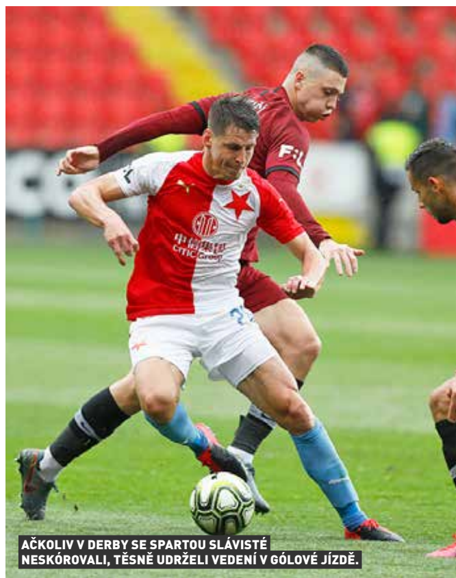
ÁČKOLIV V DERBY SE SPARTOU SLÁVISTÉ NESKÓROVALI, TĚSNĚ UDRŽELI VEDENÍ V GÓLOVÉ JÍZDĚ.

V epilogu nadstavby využili fotbalisté Plzně bezbrankové remízy pražských „S“ v derby v Edenu k tomu, aby se mezi oba rivaly na špičce soutěže efektivně vklínili, neboť doma porazili Liberec, který dorazil ve velmi kombinované sestavě, vysoko 4:0. Slovan pak v nedělním zápase kvalifikace o Evropskou ligu, kvůli kterému předtím šetřil některé opory, zvítězil U Nisy 2:0 nad Mladou Boleslaví, a předskočil ji zároveň o jedinou trefu v počtu vstřelených branek.