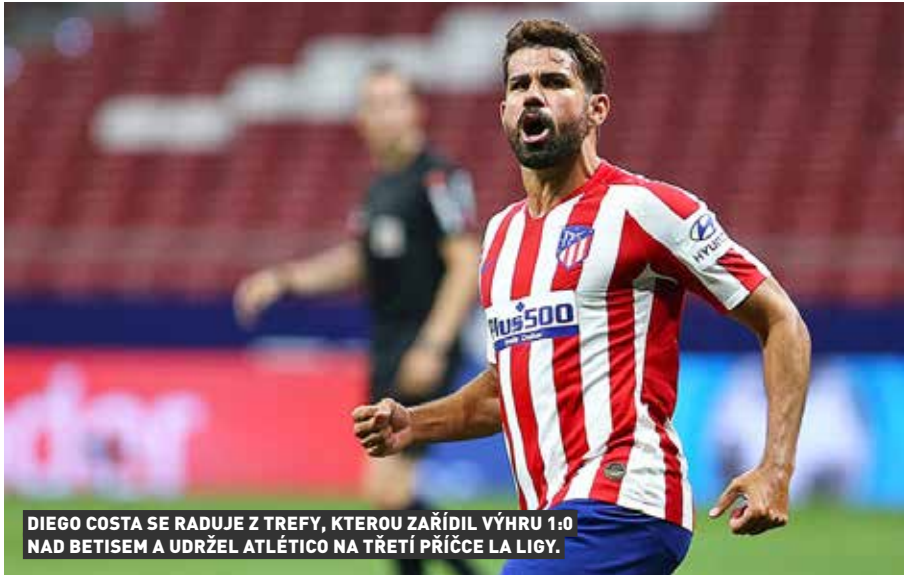
DIEGO COSTA SE RADUJE Z TREFY, KTEROU ZAŘÍDIL VÝHRU 1:0 NAD BETISEM A UDRŽEL ATLÉTICO NA TŘETÍ PŘÍČCE LA LIGY.

Žádné klopýtnutí, za titulem letí nekompromisně. Fotbalisté madridského Realu nedávají šanci chytout Barceloně druhý dech a už ve čtvrtek mohou propuknout jejich velké mistrovské oslavy!