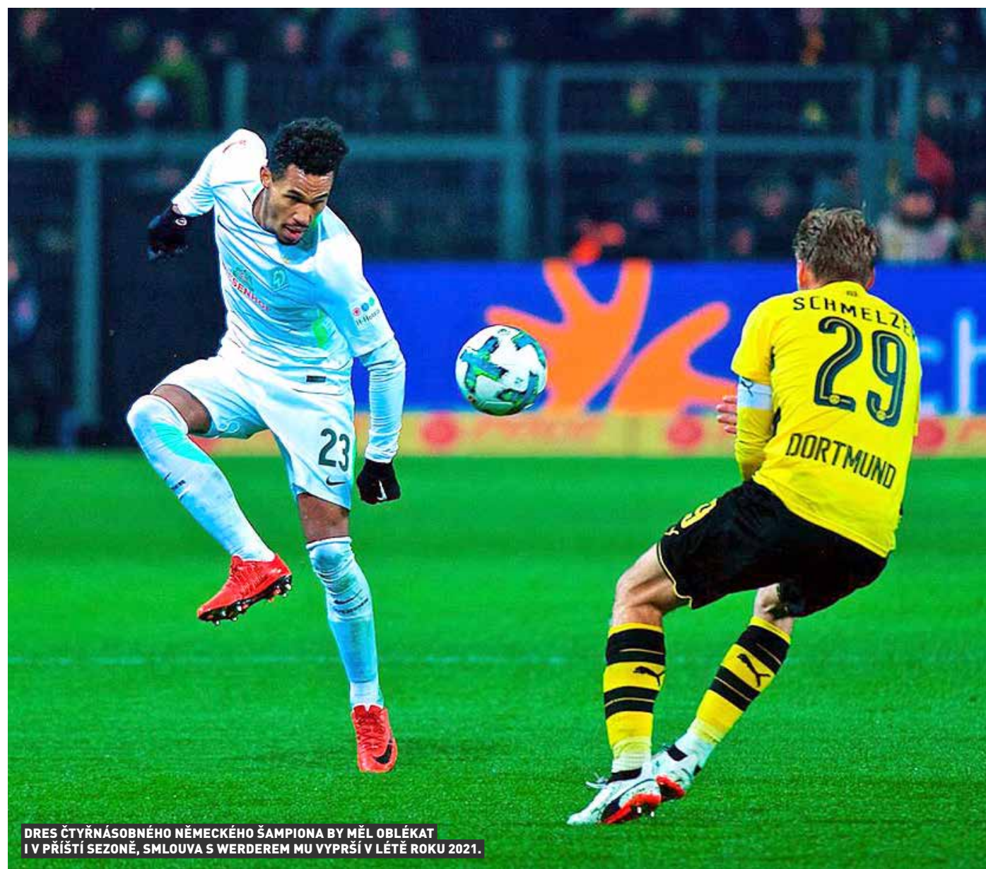
DRES ČTYRNÁSOBNÉHO NĚMECKÉHO ŠAMPIONA BY MĚL OBLÉKAT I V PŘÍŠTÍ SEZONĚ, SMLOUVA S WERDEREM MU VYPRŠÍ V LÉTĚ ROKU 2021.