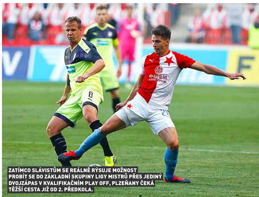
ZATÍMCO SLÁVISTŮM SE REÁLNĚ RÝSUJE MOŽNOST PROBÍT SE DO ZÁKLADNÍ SKUPINY LIGY MISTRŮ PŘES JEDINÝ DVOJZÁPAS V KVALIFIKAČNÍM PLAY OFF, PLZEŇANY ČEKÁ TĚŽŠÍ CESTA JIŽ OD 2. PŘEDKOLA.

Po včerejšku je již kompletní složení českých klubů v novém ročníku evropských pohárů. Jako první z této pětky zasáhnou do kvalifikace fotbalisté Plzně. Úřadující vicemistr 25., nebo 26. srpna odehraje 2. předkolo Ligy mistrů. Ligový šampion Slavia má velkou šanci, že do kvalifikace prestižní soutěže vstoupí stejně jako vloni až v závěrečném 4. předkole. Vítěz domácího poháru Sparta má zase naději, že postoupí rovnou do základní skupiny Evropské ligy.