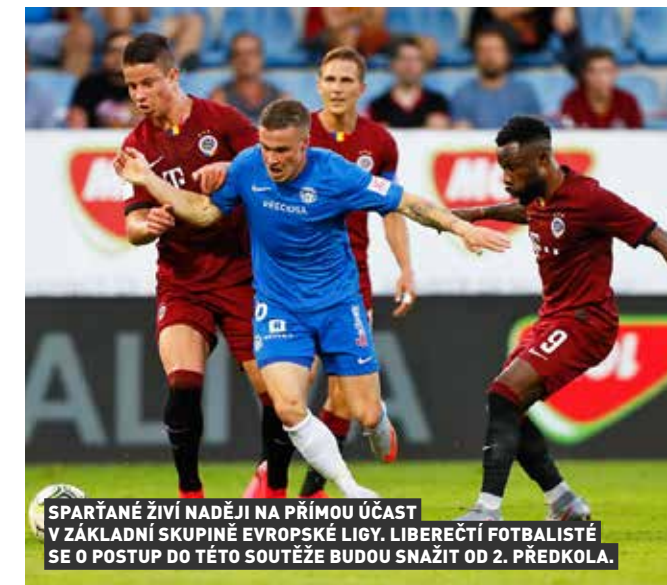
SPARTANÉ ŽIVÍ NADĚJI NA PŘÍMOU ÚČAST V ZÁKLADNÍ SKUPINĚ EVROPSKÉ LIGY. LIBEREČTÍ FOTBALISTÉ SE O POSTUP DO TĚTO SOUTĚŽE BUDOU SNAŽIT OD 2. PŘEDKOLA.

Plzeň jakožto druhý tým české ligy opět začne kvalifikaci už ve 2. předkole Ligy mistrů a Západočeši mají jistotu, že budou nasazení. Viktoria by při losu mohla dostat řeckého či chorvatského vicemistra nebo tureckého soupeře. Pokud by Plzeň přes 2. předkolo přešla, měla by jistotu minimálně účasti v základní skupině Evropské ligy. Tam může rovnou jít vítěz MOL Cupu Sparta. Letenští k tomu potřebují, aby si vítěz aktuálního ročníku Evropské ligy zároveň zajistil postup do základní skupiny i z domácí ligy nebo poháru. V opačném případě Pražané vstoupí ve 3. předkole do kvalifikace a budou nasazení.