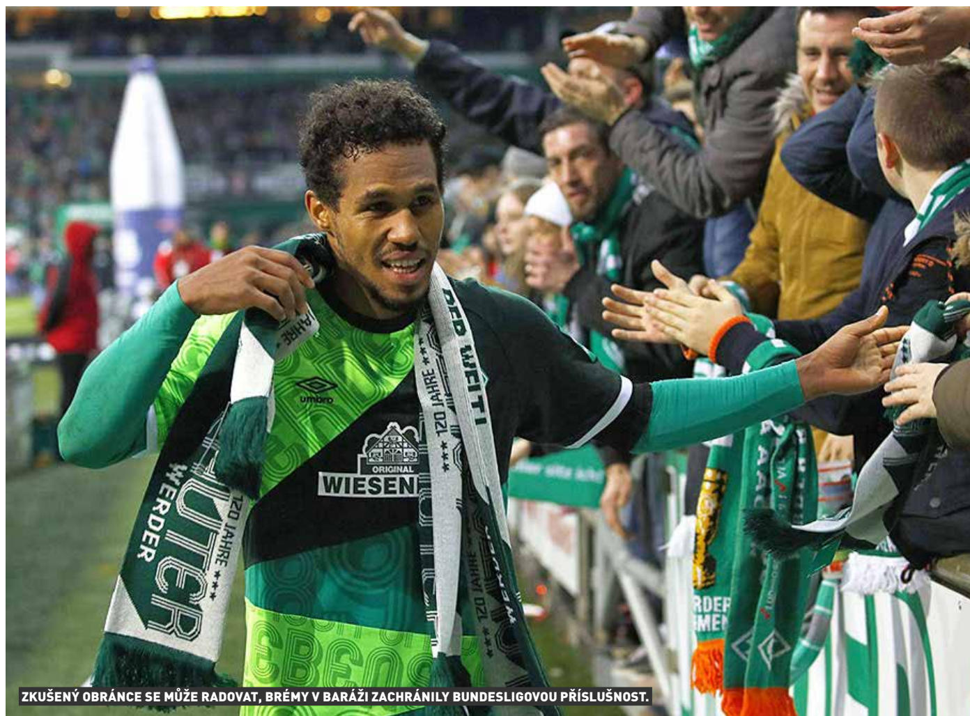
ZKUŠENÝ OBRÁNCE SE MŮŽE RADOVAT, BRÉMY V BARÁŽI ZACHRÁNILY BUNDESLIGOVOU PŘÍSLUŠNOST.

„Baráž je hrozně specifický model. Soupeř může získat něco neuvěřitelného, vždyť Heidenheim bundeslize nikdy nehrál. Kdežto my jsme mohli jen strašně moc ztratit, hráli jsme o přežití. Po psychické stránce to bylo hrozně náročné. Zvládli jsme to, což je skvělé. Ale pořád platí, že to byla špatná sezona.“