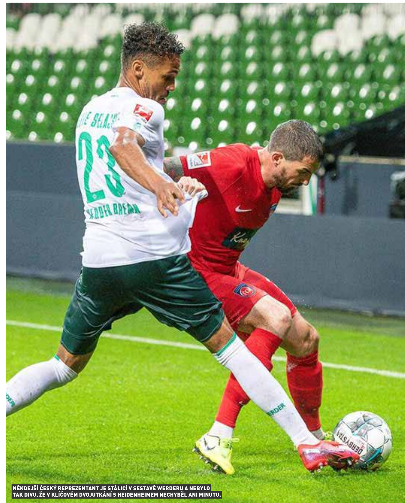
NĚKDEJŠÍ ČESKÝ REPREZENTANT JE STÁLICÍ V SESTAVĚ WERDERU A NEBYLO TAK DIVU, ŽE V KLÍČOVÉM DVOJUTKÁNÍ S HEIDENHEIMEM NECHYBĚL ANI MINUTU.