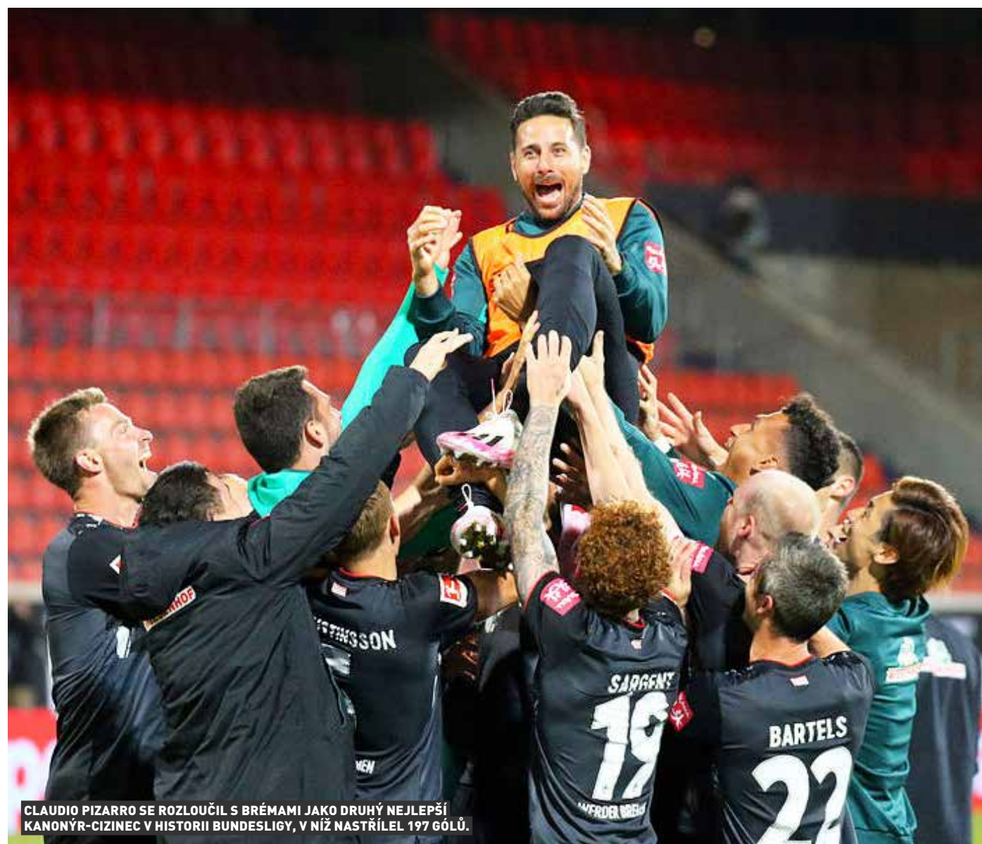
CLAUDIO PIZARRO SE ROZLOUČIL S BRÉMAMI JAKO DRUHÝ NEJLEPŠÍ KANONÝR-CIZINEC V HISTORII BUNDESLIGY, V NÍŽ NASTŘÍLEL 197 GÓLŮ.

O víkendu se zkompletovala startovní listina obou německých nejvyšších soutěží v příštím ročníku. V odvetě baráže v Ingolstadtu o setrvání ve druhé bundeslize málem prohodil hostující Norimberk domácí výhru 2:0, neboť po bezbrankovém prvním poločase třikrát po přestávce inkasoval po precizně zahraných standardních situacích.