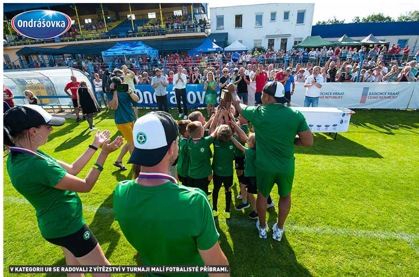
V KATEGORII U8 SE RADOVALI Z VÍTĚZSTVÍ V TURNAJI MALÍ FOTBALISTÉ PŘÍBRAMI.

Závěr letošního Ondrášovka Cupu, který je oficiálním Pohárem mládeže FAČR, obstaraly v Benešově finálové turnaje kategorií U8 a U11. Nejprve se odehrál turnaj nejmladší kategorie, v níž se z poháru pro vítěze radovali malí fotbalisté 1. FK Příbram, kteří za sebou nechali na dalších medailových pozicích slavné pražské kluby Slavii a Spartu. V kategorii U11, která seriál finálových turnajů uzavřela, dosáhla na jediný letošní titul v Ondrášovka Cup Slavia Praha před svým odvěkým rivalem Spartou a Pardubicemi.