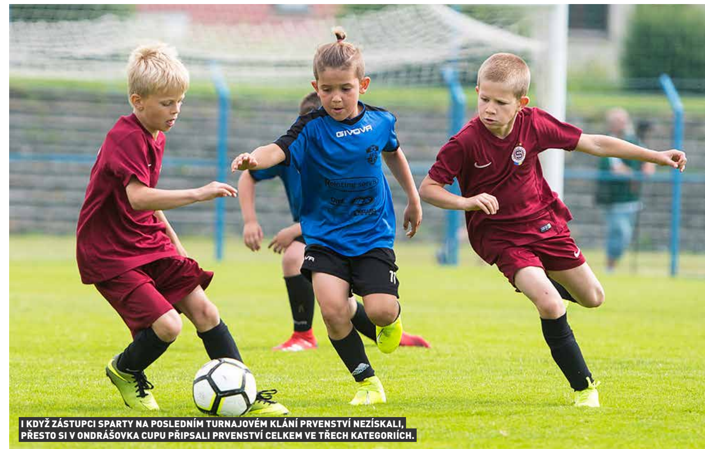
I KDYŽ ZÁSTUPCI SPARTY NA POSLEDNÍM TURNAJOVÉM KLÁNÍ PRVENSTVÍ NEZÍSKALI, PŘESTO SI V ONDRÁŠOVKA CUPU PŘÍPSALI PRVENSTVÍ CELKEM VE TŘECH KATEGORIÍCH.