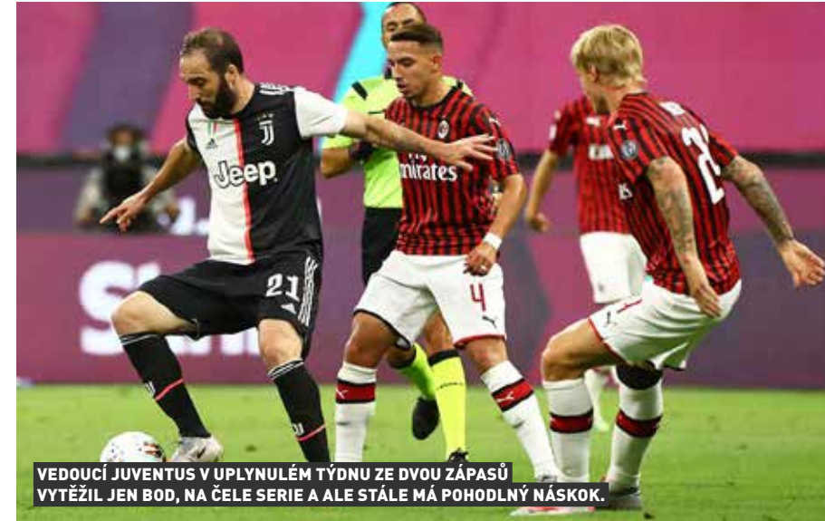
VEDOUCÍ JUVENTUS V UPLYNULÉM TÝDNU ZE DVOU ZÁPASŮ VYTYŽIL JEN BOD, NA ČELE SERIE A ALE STÁLE MÁ POKOHLNÝ NÁSKOK.

Měli na lopatě dokonce i šampiony z Juventusů a virtuálně byli už na druhé příčce! Borci Atalanty Bergamo nakonec v Turíně plichtili, nicméně opět si vysloužili ohromný aplaus vestoje. Aktuálně není v Itálii lepší tým!