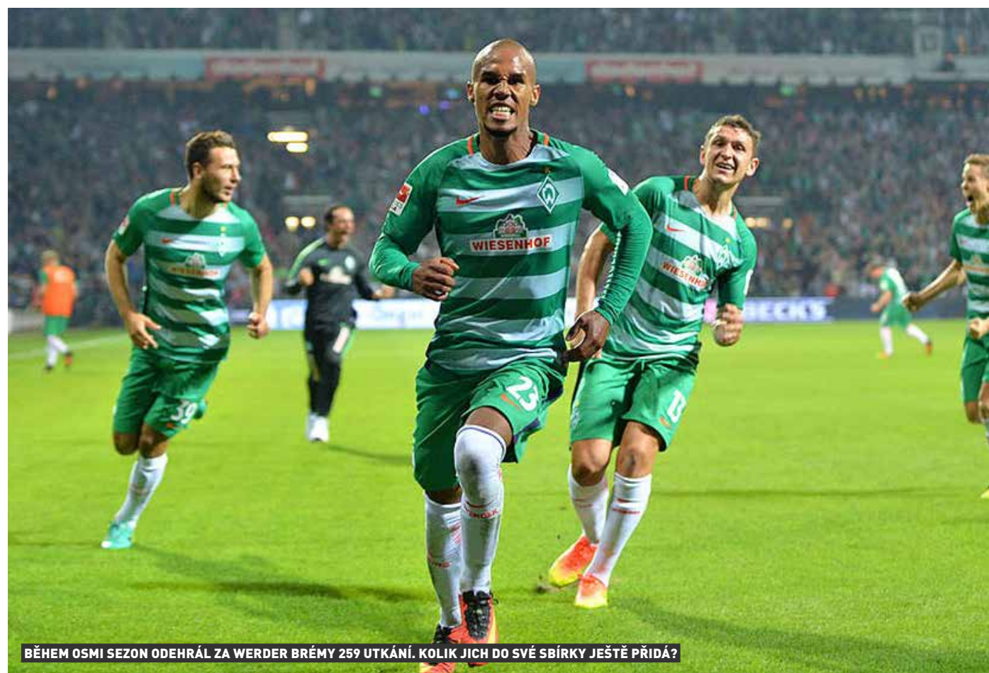
BĚHEM OSMI SEZON ODEHRÁL ZA WERDER BRÉMY 259 UTKÁNÍ. KOLIK JICH DO SVÉ SBÍRKY JEŠTĚ PŘIDÁ?

„Odpočívat, co nejvíce to půjde. Maximálně si zakupu s míčem s mými kluky v Liberci na zahradě.“ ■