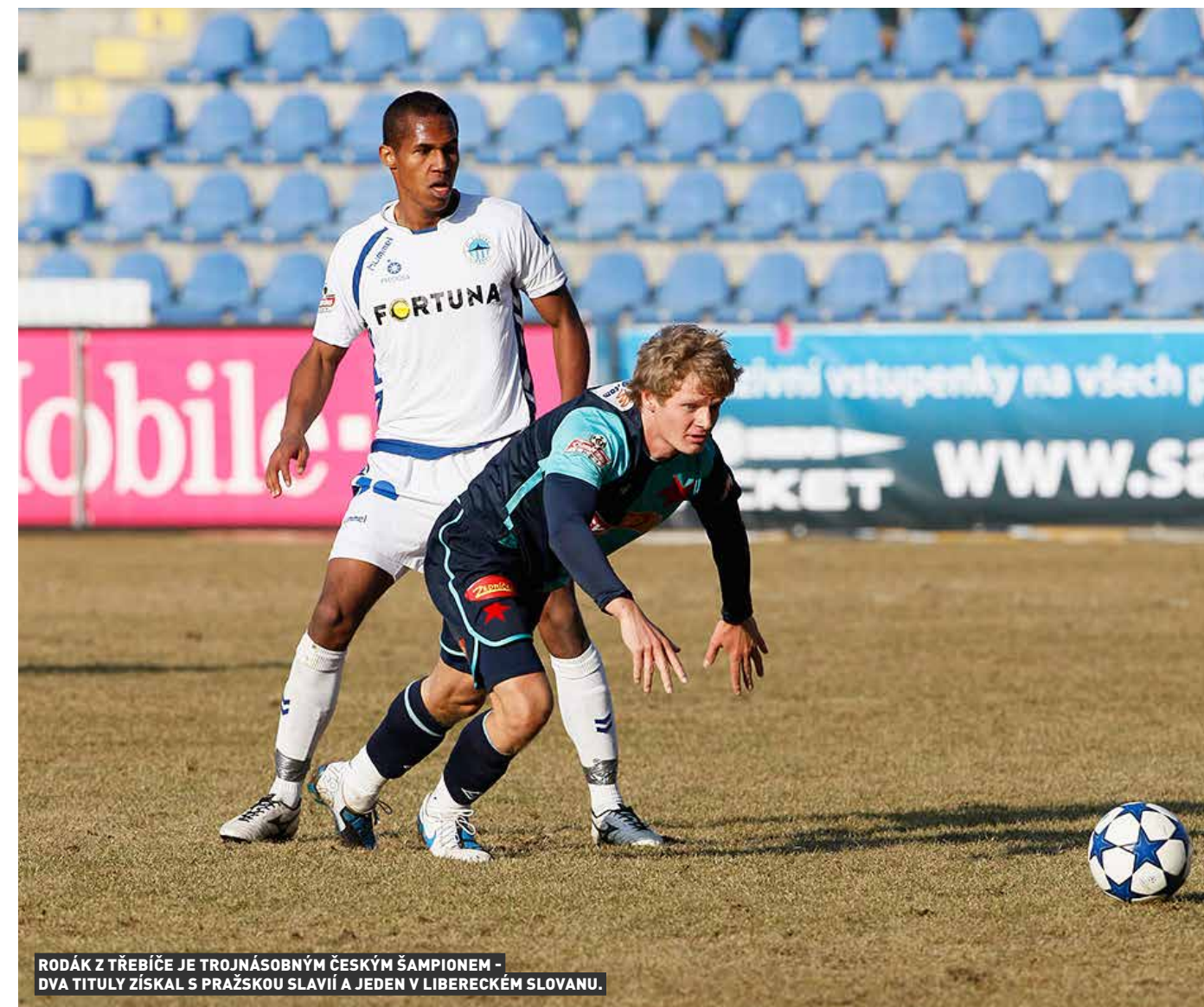
RODÁK Z TŘEBÍČE JE TROJNÁSOBNÝM ČESKÝM ŠAMPIONEM - DVA TITULY ZÍSKAL S PRAŽSKOU SLAVIÍ A JEDEN V LIBERECKÉM SLOVANU.

„Je vidět, jak komplikované je dostávat se zpátky. Tím spíš pro tradiční kluby. A to navíc finanční možnosti Hamburku jsou jinde než naše, přestože ve druhé lize jim asi někteří sponzoři odešli. Ale určitě měli ambice se po sestupu hned vrátit. A teď je čeká třetí sezona ve druhé lize, což je pro Hamburk sportovní katastrofa.“