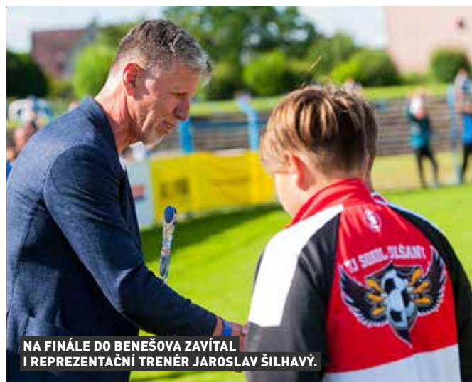
NA FINÁLE DO BENEŠOVA ZAVÍTAL I REPREZENTAČNÍ TRENÉR JAROSLAV ŠILHAVÝ.

Vítězství Slavie sledoval i reprezentační trenér Jaroslav Šilhavý, jeho hráčská i trenérská kariéra je spojená právě s vršovickým klubem. „Lidem z Ondrášovky i FAČR a všem z celého projektu, kteří se o něj starají, patří velký dík. Děti jsou dychtivé hrát takové turnaje. Máme tady týmy, které postoupily z celé republiky a na jednom místě tak máme možnost vidět talenty, které jsou budoucností