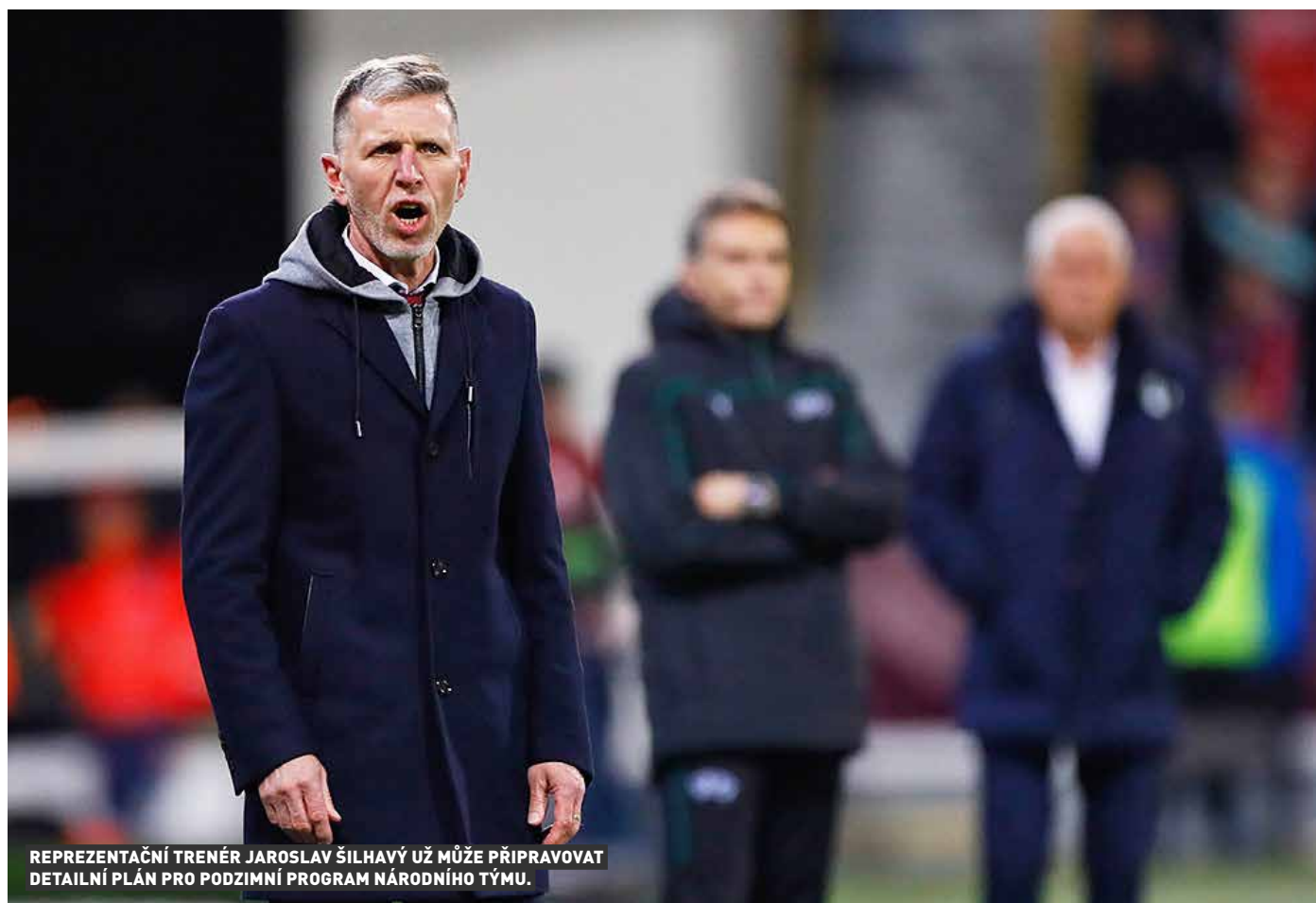
REPREZENTAČNÍ TRENÉR JAROSLAV ŠILHAVÝ UŽ MŮŽE PŘIPRAVOVAT DETAILNÍ PLÁN PRO PODZIMNÍ PROGRAM NÁRODNÍHO TÝMU.

Česká reprezentace už zná kompletní podzimní program. Kromě zápasů v Lize národů ji čekají také dvě přípravná utkání. Národní tým nastoupí 7. října na Kypru a o měsíc později 11. listopadu v Lipsku proti Německu. Česko tak změří síly s jedním z nejlepších a nejslavnějších týmů světa. Německo je čtyřnásobným mistrem světa a trojnásobným evropským šampionem.