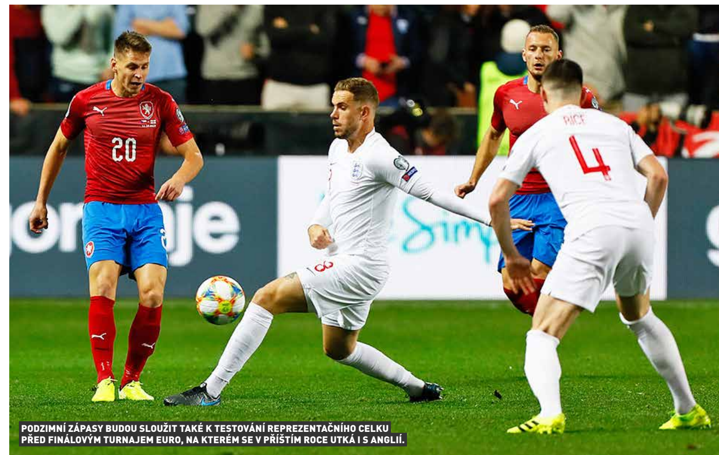
PODZIMNÍ ZÁPASY BUDOU SLOUŽIT TAKÉ K TESTOVÁNÍ REPREZENTAČNÍHO CELKU PŘED FINÁLOVÝM TURNAJEM EURO, NA KTERÉM SE V PŘÍŠTÍM ROCE UTKÁ I S ANGLIÍ.

Česká reprezentace už zná kompletní podzimní program. Kromě zápasů v Lize národů ji čekají také dvě přípravná utkání. Národní tým nastoupí 7. října na Kypru a o měsíc později 11. listopadu v Lipsku proti Německu. Česko tak změří síly s jedním z nejlepších a nejslavnějších týmů světa. Německo je čtyřnásobným mistrem světa a trojnásobným evropským šampionem.