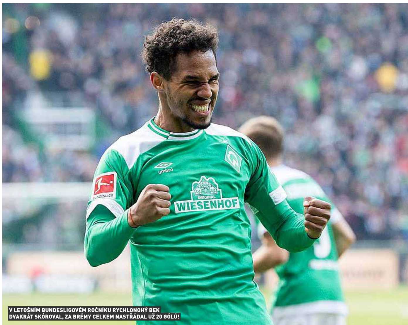
V LETOŠNÍM BUNDESLIGOVÉM ROČNÍKU RYCHLONOHÝ BEK DVAKRÁT SKÓROVAL, ZA BRÉMY CELKEM NASTŘÁDAL UŽ 20 GÓLŮ!

„Každá sezona je náročná, každá v něčem jiném. První rok byl těžký vzhledem k aklimatizaci, jazyku a podobně. Další zase kvůli boji o místo v sestavě. Ovšem z komplexního pohledu byla tahle opravdu nejtěžší. Kdyby špatně dopadla, mělo by to vliv na celý chod klubu, na celé město, které Werderem žije. Jednalo by se o obrovskou sportovní tragédii. I když člověk nechce, tak mu k tomu myšlenky sklouzávají. Nechcete, aby se něco takového stalo, když za klub hraje právě vy a za ta léta jste si vybudoval ke všemu tady vztah. ..“