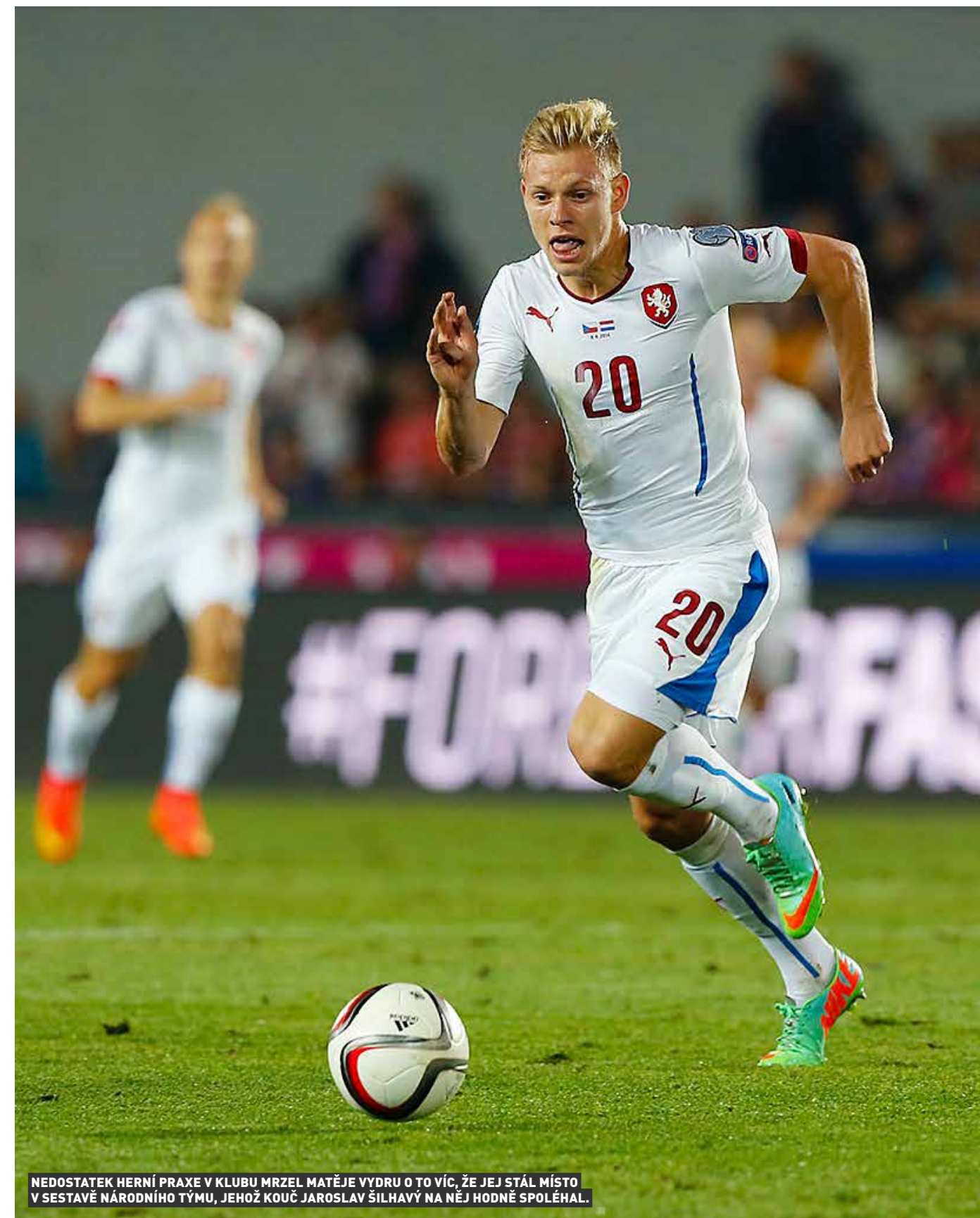
NEDOSTATEK HERNÍ PRAXE V KLUBU MRZEL MATĚJE VYDRU O TO VÍC, ŽE JEJ STÁL MÍSTO V SESTAVĚ NÁRODNÍHO TÝMU, JEHOŽ KOUČ JAROSLAV ŠILHAVÝ NA NĚJ HODNĚ SPOLÉHAL.