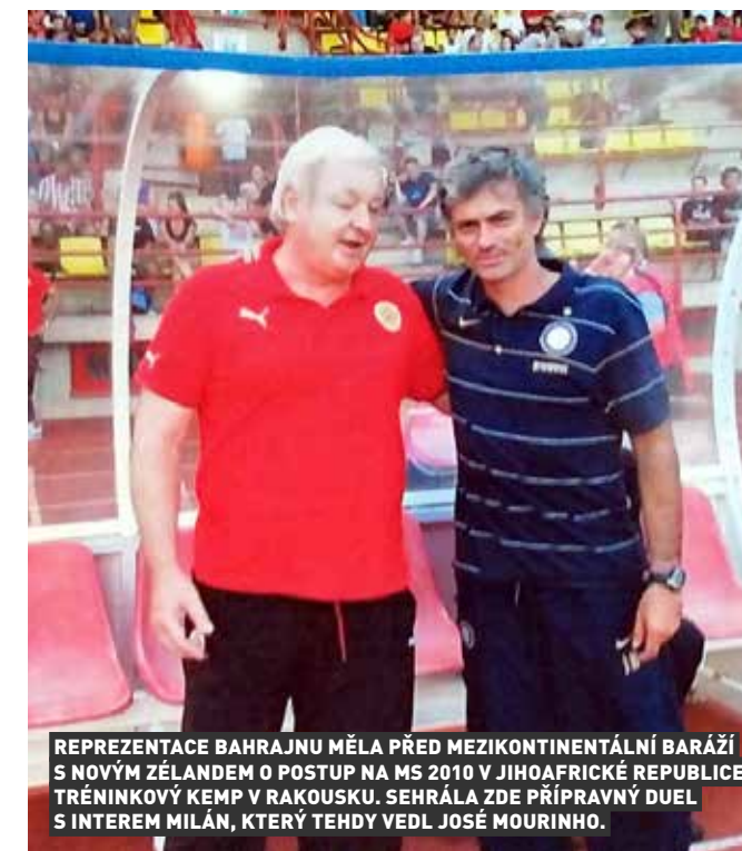
REPREZENTACE BAHRAJNU MĚLA PŘED MEZIKONTINENTÁLNÍ BARÁŽÍ S NOVÝM ZÉLANDEM O POSTUP NA MS 2010 V JIHOAFRICKÉ REPUBLICCE TRÉNINKOVÝ KEMP V RAKOUSKU. SEHRÁLA ZDE PŘÍPRAVNÝ DUEL S INTEREM MILÁN, KTERÝ TEHDY VEDL JOSÉ MOURINHO.

Nejsem si ale jistý, jestli mistrovství světa 2022 bude znamenat i průlom arabských týmů. Tyhle země mají vysoký životní standard, takže hráčům schází potřebná motivace. Mají zde výborné podmínky, a proto se jim třeba na rozdíl od afrických fotbalistů ne-