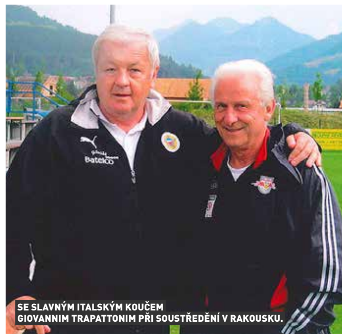
SE SLAVNÝM ITALSKÝM KOUČEM GIOVANNIM TRAPATTONIEM PŘI SOUSTŘEDĚNÍ V RAKOUSKU.

Vrátil jsem se zpět do Kuvajtu. Definitivní konec kuvajtského angažmá přišel po asijských olympijských hrách v Thajsku, které byly úspěšné. Hráli jsme finále fotbalového turnaje, a i když jsme prohráli z Iránem, byl to bezesporu úspěch. Působení u klubu Kazma a později i u národního mužstva Kuvajtu bylo úspěšné, měli jsme jedno z nejlepších mužstev v Golfu, což do budoucna mělo váhu. Skončil jsem tam po šesti letech, všechno odstěhoval domů a odletěl do Česka.