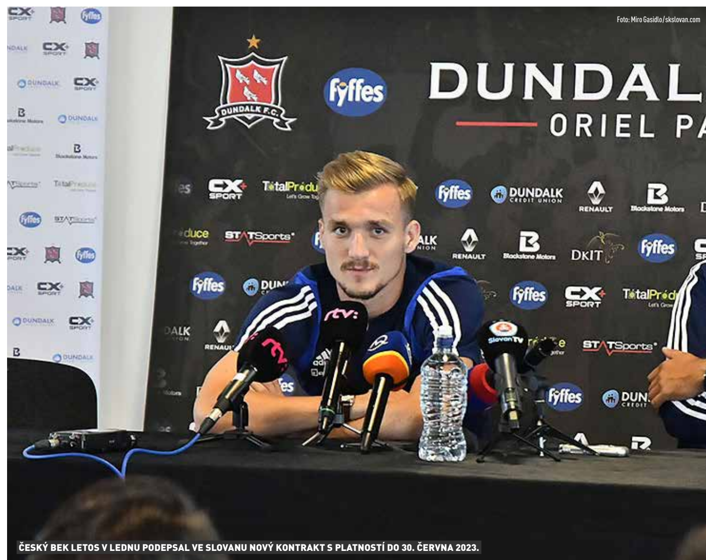
ČESKÝ BEK LETOS V LEDNU PODEPSAL VE SLOVANU NOVÝ KONTRAKT S PLATNOSTÍ DO 30. ČERVNA 2023.

„Ze slovenské ligy si mě asi pamatuje, ale v tomto směru žádné kontakty nejsou.“