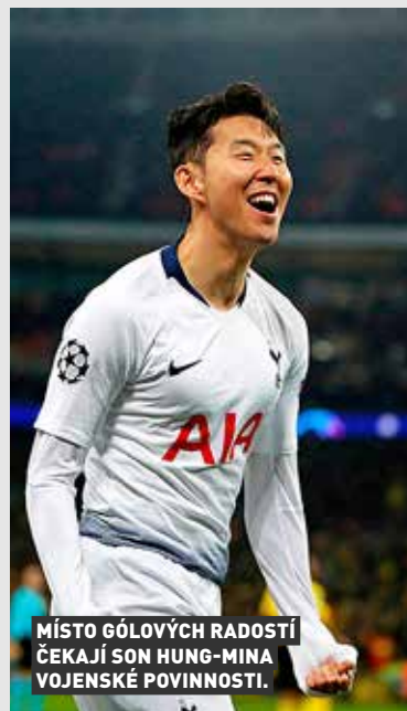
MÍSTO GÓLOVÝCH RADOSTÍ ČEKÁJÍ SON HUNG-MINA VOJENSKÉ POVINNOSTI.

Útočník Tottenhamu Son Hung-min doufá, že si během přerušení anglické Premier League kvůli pandemii koronaviru odbude v rodné Koreji povinnou vojenskou službu. Normálně by musel strávit na vojně 21 měsíců. Díky předloňskému triumfu na Asijských hrách získali korejští reprezentanti výjimku a jsou povinni absolvovat jen měsíční výcvik.