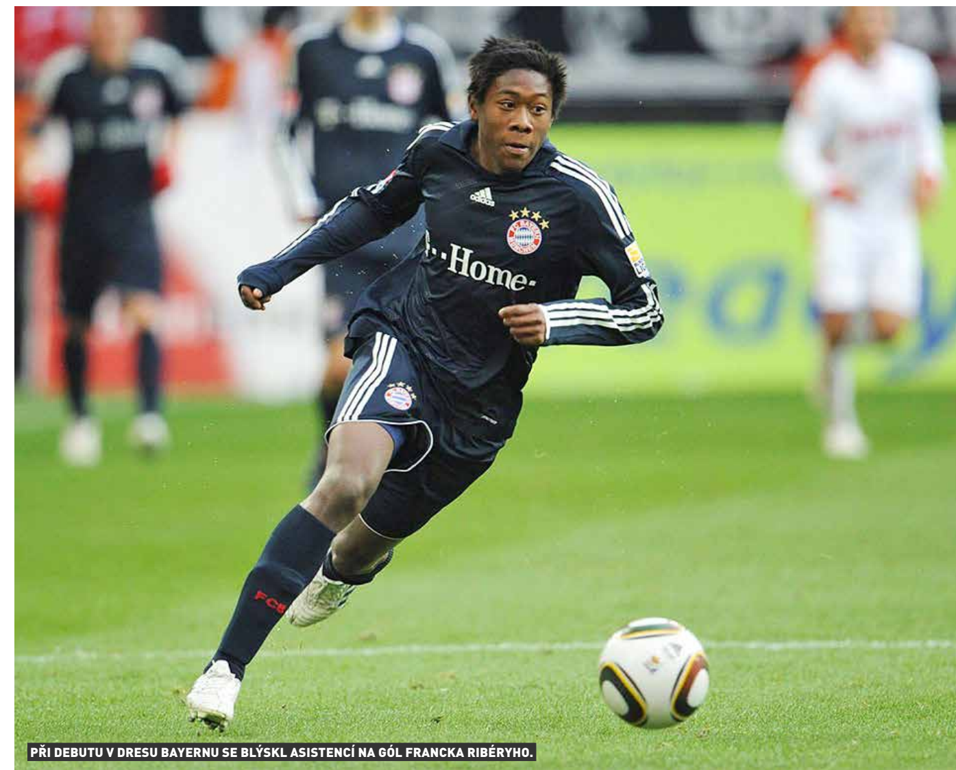
PŘI DEBUTU V DRESU BAYERNU SE BLÝSKL ASISTENCÍ NA GÓL FRANCKA RIBÉRYHO.

se rakouský mladík napevno zabydlel v základní sestavě Bayernu, ovšem ve výsledku prožil smolnou sezonu - v bundeslize skončil mnichovský gigant o osm bodů za Dortmundem, v Lize mistrů se sice prokousal do finále, v něm ovšem Alaba nesměl kvůli trestu za karty hrát a bavorský velkoklub na vlastním stadionu nestačil na londýnskou Chelsea, které podlehl v penaltovém rozstřelu. „Bylo to bolestivé. Nemohl jsem pomoci týmu, obzvláště v takovém zápase, finále Ligy mistrů, které jsme nakonec prohráli. Krátce po zápase jsem ale cítil, že máme speciální tým a v příští sezoně můžeme něčeho dosáhnout. Byli jsme lepší než Chelsea a zasloužili jsme si vyhrát. V přípravě na další sezonu jsem u každého z našeho týmu cítil obrovský hlad po úspěchu. Všichni jsme tomu dali těch pár procent navíc a v roce 2013 jsme napsali neuvěřitelný kus historie,“ vzpomíná Alaba na bolestnou zkušenost, která však ve výsledku jemu samotnému i celému Bayernu výrazně pomohla. Ambiciózní mančaft pod taktovkou zkušeného trenéra Juupa Heynckese vyhrál senzační treble, které okořenil triumfem v Lize mistrů nad rivaly z Dortmundu.