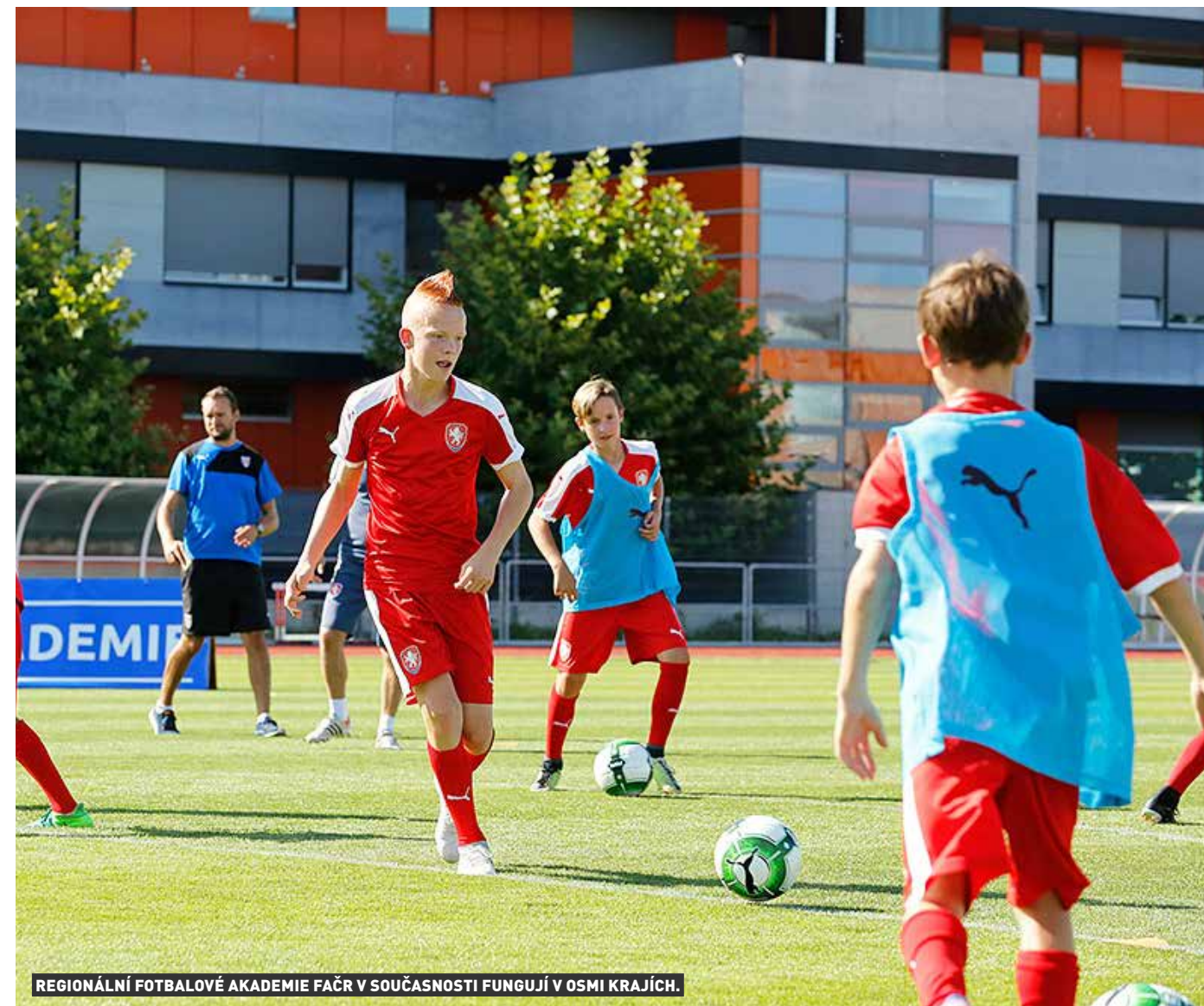
REGIONÁLNÍ FOTBALOVÉ AKADEMIE FAČR V SOUČASNOSTI FUNGUJÍ V OSMI KRAJÍCH.

Nouzový stav v Česku, vyvolaný pandemií koronaviru COVID-19, zastavil život i v regionálních fotbalových akademiích pro hráče ve věku 14 a 15 let. Příprava talentů pokračuje v rámci možností z domova, protože jsou zavřené školy, internáty i sportoviště. Mladí fotbalisté dostávají od trenérů podobně jako od učitelů vypracované tréninkové plány, které plní.