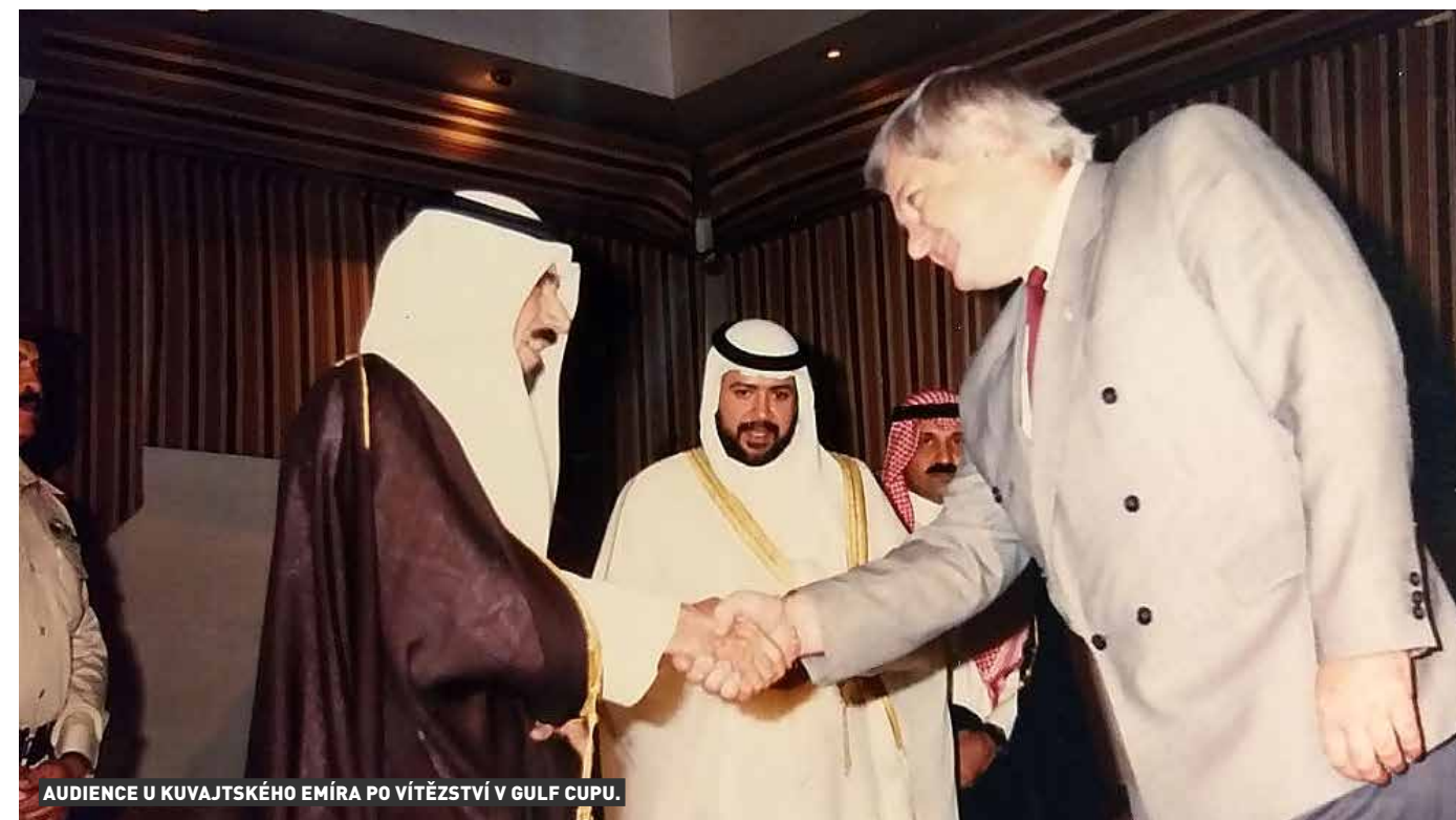
AUDIENCE U KUVAJTSKÉHO EMÍRA PO VÍTĚZSTVÍ V GULF CUPU.

Omán vždy býval většinou ve spodní polovině tabulky, ať už na klubové či reprezentační úrovni. Měl jeden bezvadný stadion - SULTAN QABUS - nic víc. Odehrál jsem tam snad 70 zápasů. Měl jsem na starost olympijský výběr i „áčko“, osm kluků se prolínalo oběma týmy. Absolvovali jsme úspěšnou kvalifikaci na olympijský turnaj 2004 v Athénách, na který jsme o jediný gól bohužel nepostoupili... Pak se hrál Gulf cup a my skončili ve finále v Kataru druží. Zápas skončil remízou, kopaly se penalty. Bylo samozřejmě určeno, kdo je bude kopat. Našemu gólmanovi Ali Habšimu, který potom sedm let působil v Anglii, jsem důrazně řekl, ať jde kopat penaltu jako úplně poslední. Za stavu 1:1 na penalty dvě další chytil a vedli jsme 3:1. Vzal si balon a šel kopat, že soupeře dorazí. Jenže nedal, nechtyl už žádný další pokutový kop, oni všechno proměnili a my už nedali nic! V tu chvíli vám vůbec nejde na rozum, jak je možné se sami připravit o první velký historický triumf... Aliho stejně jako další mladé hráče bez zkušeností ale s odstupem času chápu.