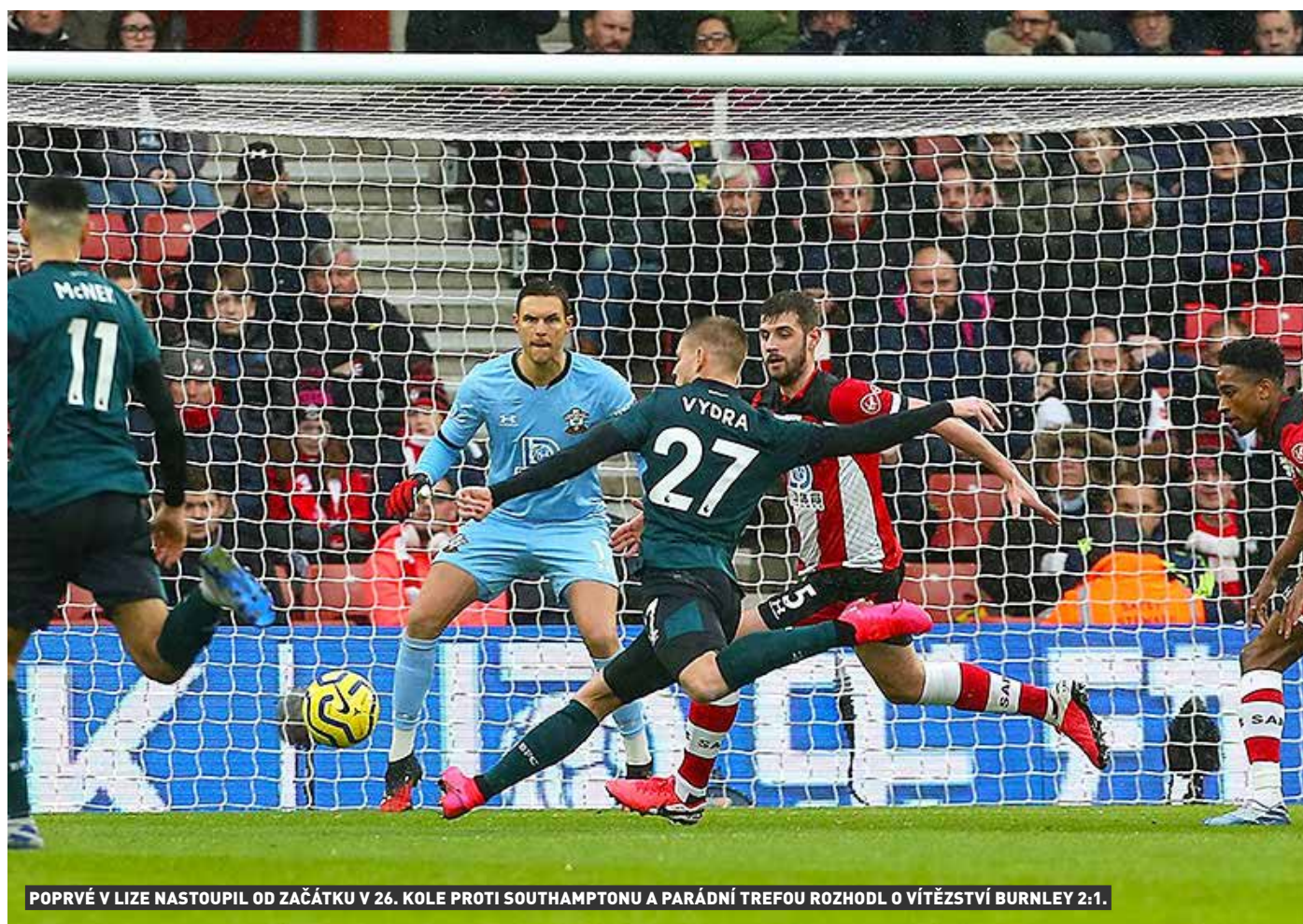
POPŘVÉ V LIZE NASTOUPIL OD ZAČÁTKU V 26. KOLE PROTI SOUTHAMPTONU A PARÁDNÍ TREFOU ROZHODL O VÍTĚZSTVÍ BURNLEY 2:1.