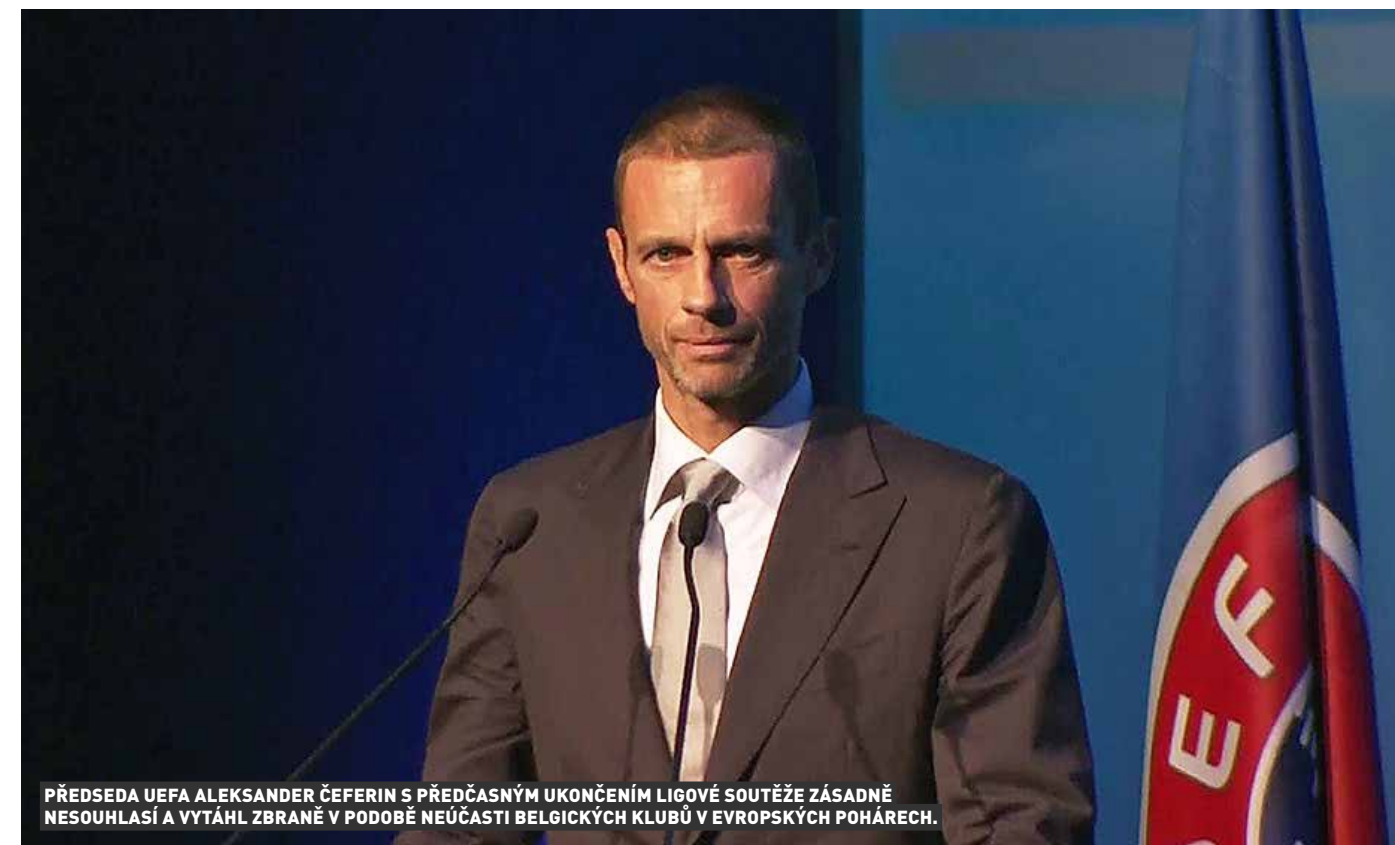
PŘEDSEDA UEFA ALEKSANDER ČEFERIN S PŘEDČASNÝM UKONČENÍM LIGOVÉ SOUTĚŽE ZÁSADNĚ NESOUHLASÍ A VYTÁHL ZBRANĚ V PODOBĚ NEÚČASTI BELGICKÝCH KLUBŮ V EVROPSKÝCH POHÁRECH.

Po středeční videokonferenci generálních sekretářů všech členských zemí UEFA s jejím vedením to vypadalo, že evropský fotbal sladil krok, jak v příštích měsících prodloužit a hlavně dohrát sezonu, stále přerušenu pandemií koronaviru COVID-19. O pouhý den později však ukončil belgický svaz kolo před koncem základní části a před celou nadstavbou tamní nejvyšší soutěž.