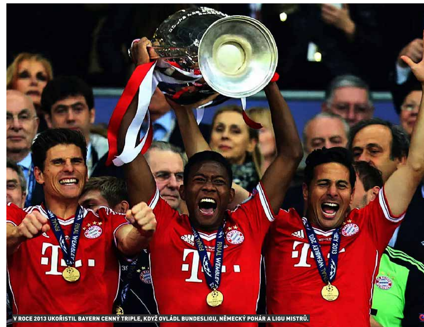
V ROCE 2013 UKOŘISTIL BAYERN CENNÝ TRIPLE, KDYŽ OVLÁDL BUNDESLIGU, NĚMECKÝ POHÁR A LIGU MISTRŮ.

Alaba tak vspěl v jednu z vůdčích osobností Bayernu a v klíčového borce, jehož případná ztráta by mnichovský celek velmi bolela. Udrží jej vedení ve svých řadách? ■