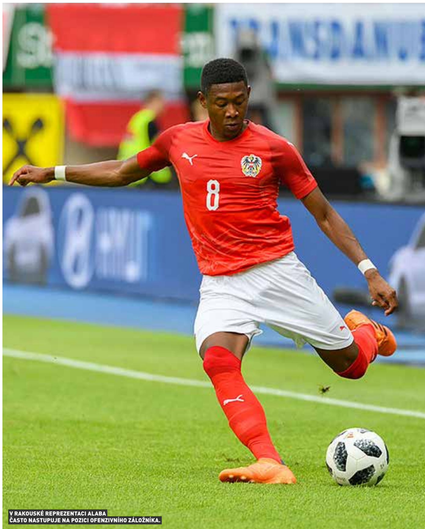
V RAKOUSKÉ REPREZENTACI ALABA ČASTO NASTUPEJE NA POZICI OFENZIVNÍHO ZÁLOŽNÍKA.