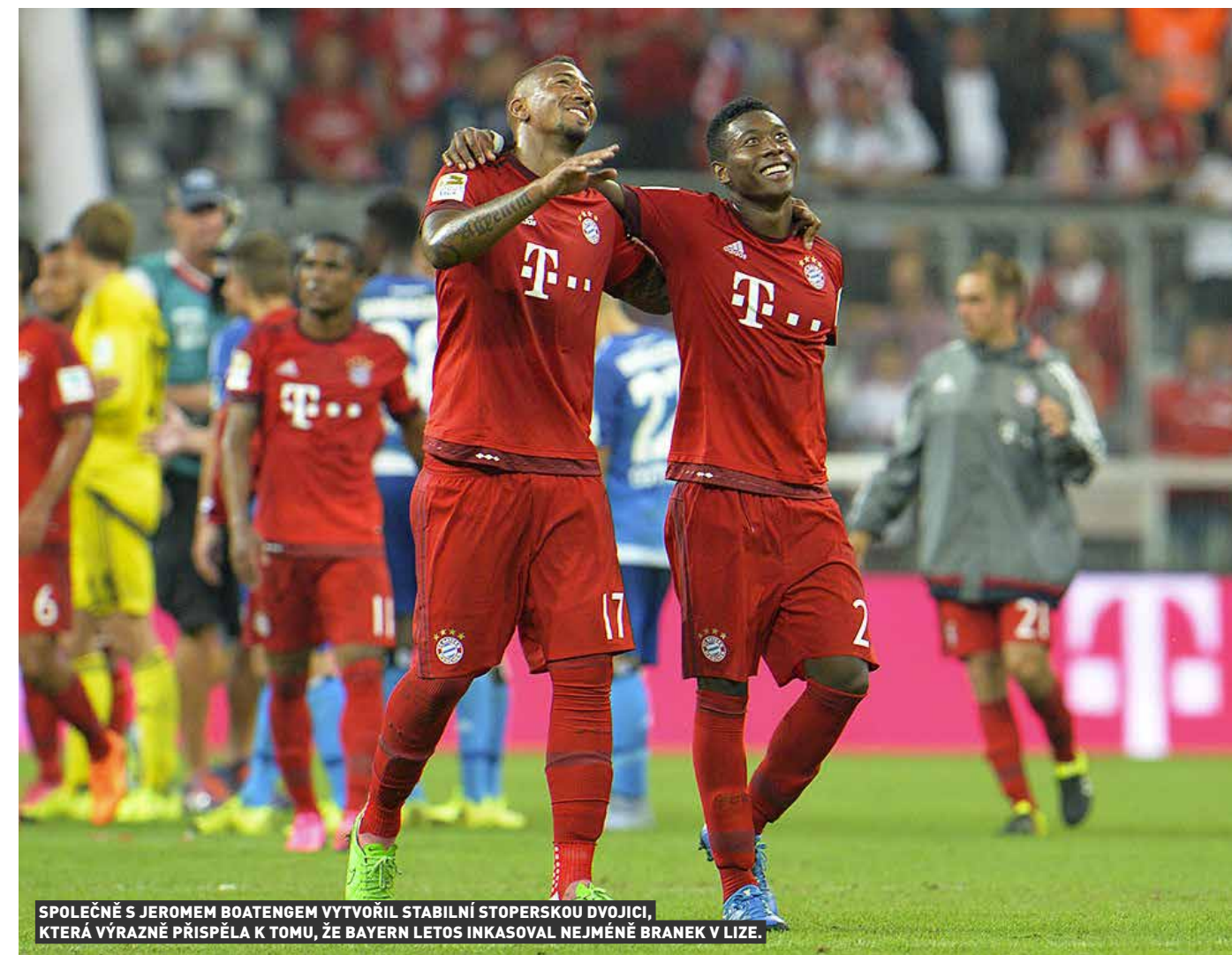
SPOLEČNĚ S JEROMEM BOATENGEM VYTVORIL STABILNÍ STOPERSKOU DVOJICI, KTERÁ VÝRAZNĚ PŘÍSPĚLA K TOMU, ŽE BAYERN LETOS INKASOVAL NEJMÉNĚ BRANEK V LIZE.