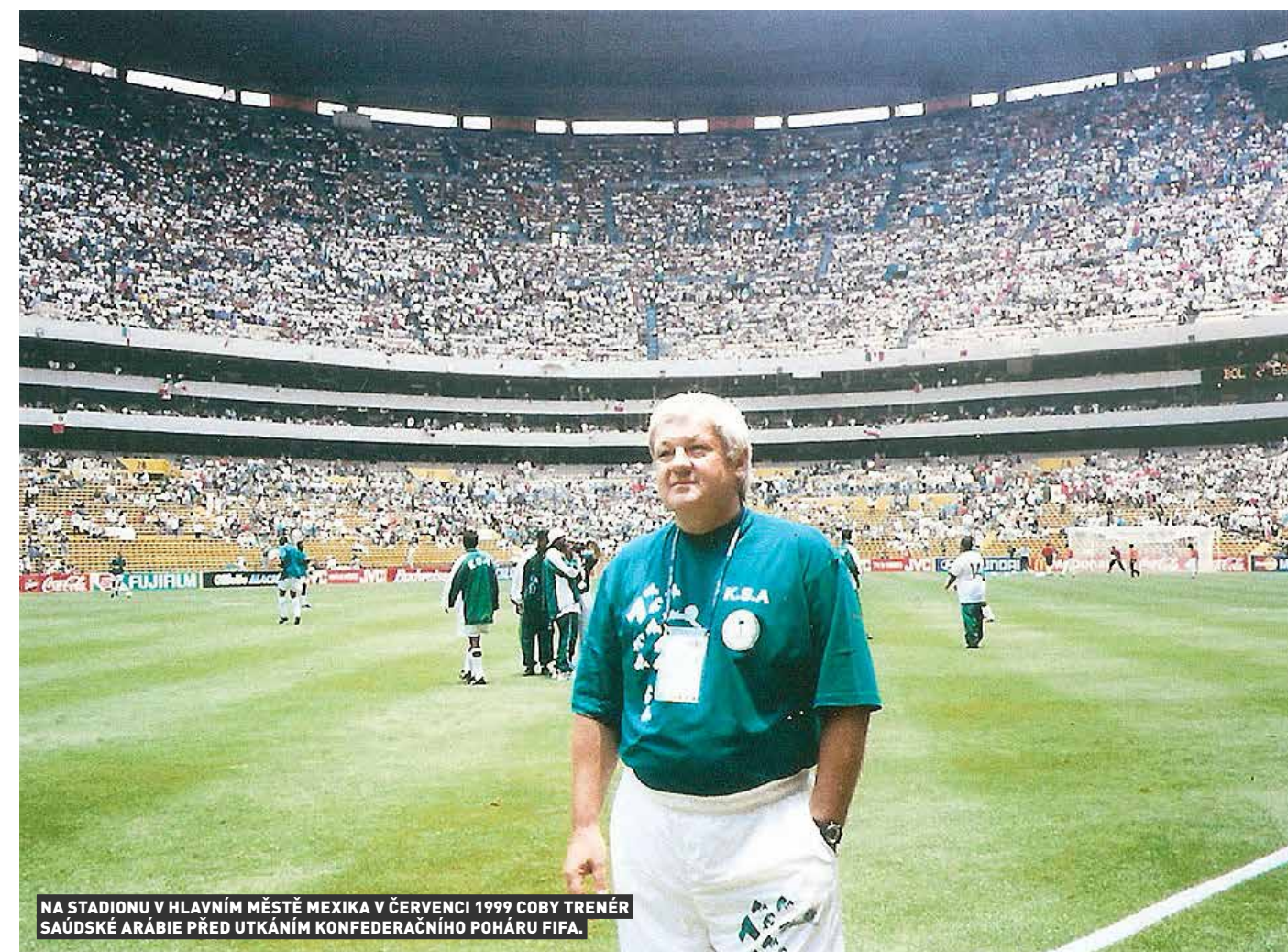
NA STADIONU V HLAVNÍM MĚSTĚ MEXIKA V ČERVENCI 1999 COBY TRENÉR SAŮDSKÉ ARÁBIE PŘED UTKÁNÍM KONFEDERAČNÍHO POHÁRU FIFA.