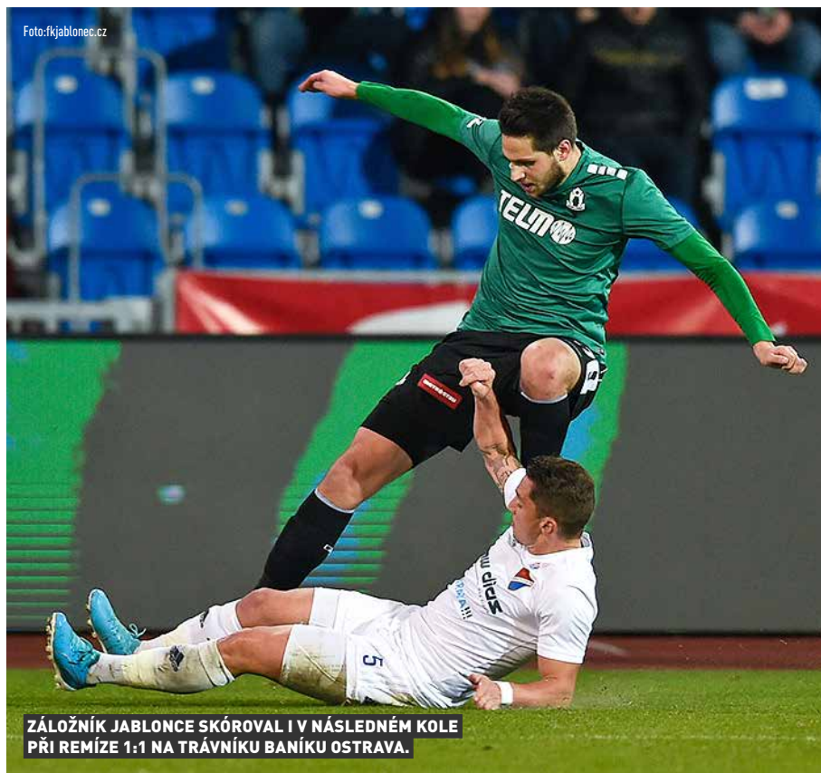
ZÁLOŽNÍK JABLONCE SKÓROVAL I V NÁSLEDNÉM KOLE PŘI REMÍZE 1:1 NA TRÁVNÍKU BANÍKU OSTRAVA.

V neděli se na Střelnici odehrálo imaginární derby Jablonce s Libercem. Prodávaly se na něj vstupenky za sto korun, celý výtěžek jde do Krajské nemocnice v Liberci na podporu v boji s koronavirem. Akci moc kvituju, je dobře, že se podařilo vybrat peníze a při-