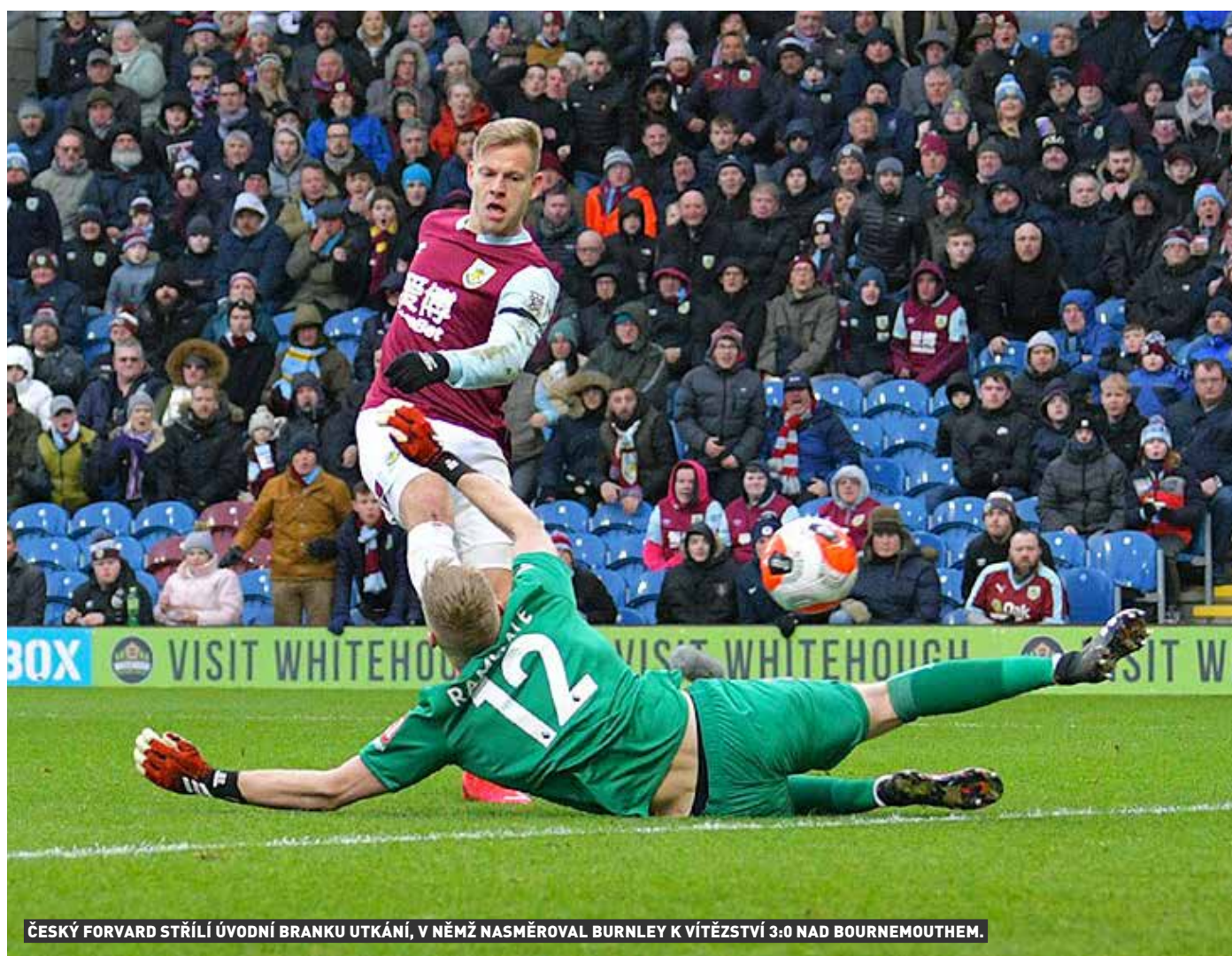
ČESKÝ FORWARD STŘÍLÍ ÚVODNÍ BRANKU UTKÁNÍ, V NĚMŽ NASMĚROVAL BURNLEY K VÍTĚZSTVÍ 3:0 NAD BOURNEMOUTHEM.