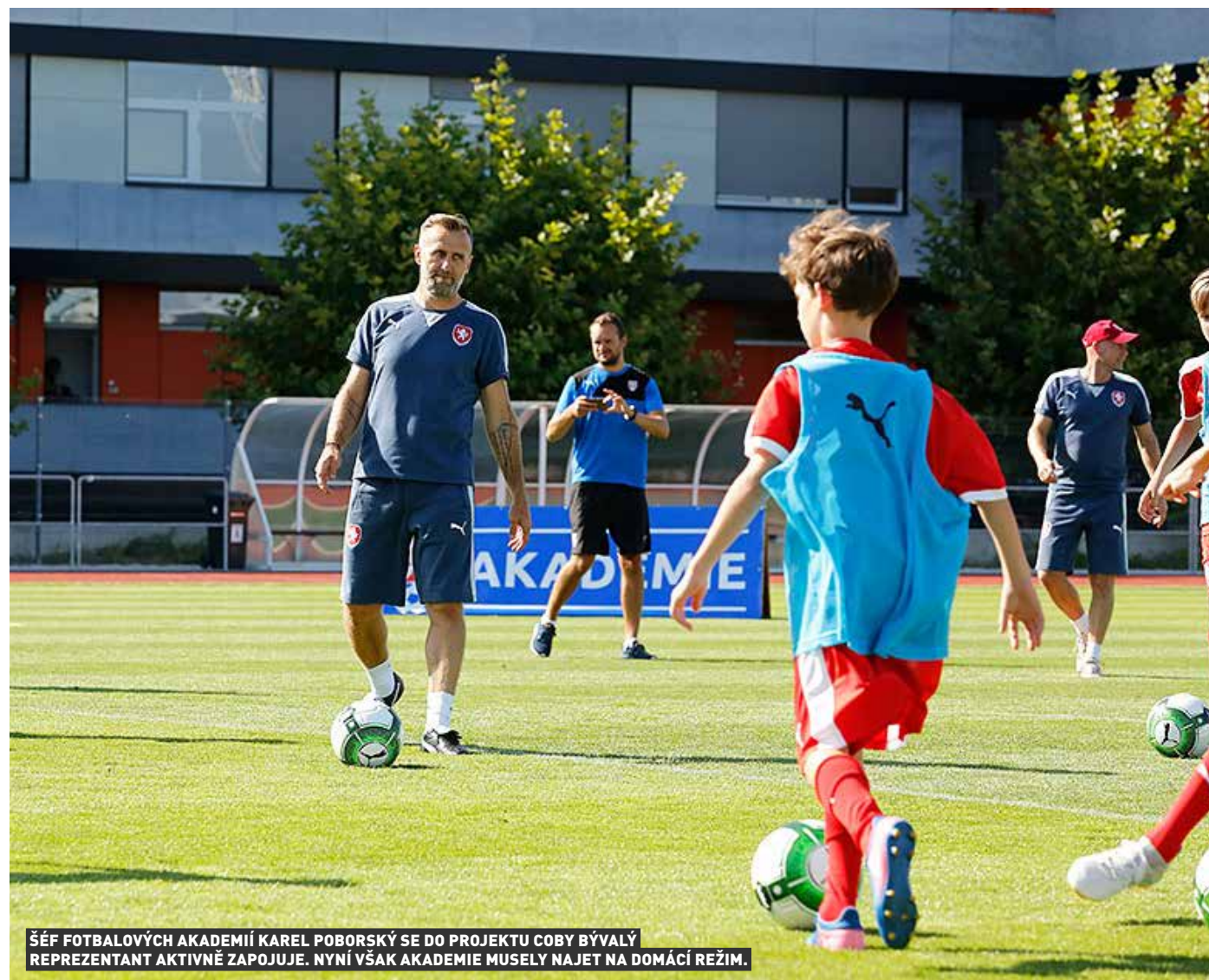
ŠÉF FOTBALOVÝCH AKADEMÍ KAREL POBORSKÝ SE DO PROJEKTU COBY BÝVALÝ REPREZENTANT AKTIVNĚ ZAPOJUJE. NYNÍ VŠAK AKADEMIE MUSELY NAJET NA DOMÁCÍ REŽIM.

Nouzový stav v Česku, vyvolaný pandemií koronaviru COVID-19, zastavil život i v regionálních fotbalových akademiích pro hráče ve věku 14 a 15 let. Příprava talentů pokračuje v rámci možností z domova, protože jsou zavřené školy, internáty i sportoviště. Mladí fotbalisté dostávají od trenérů podobně jako od učitelů vypracované tréninkové plány, které plní.