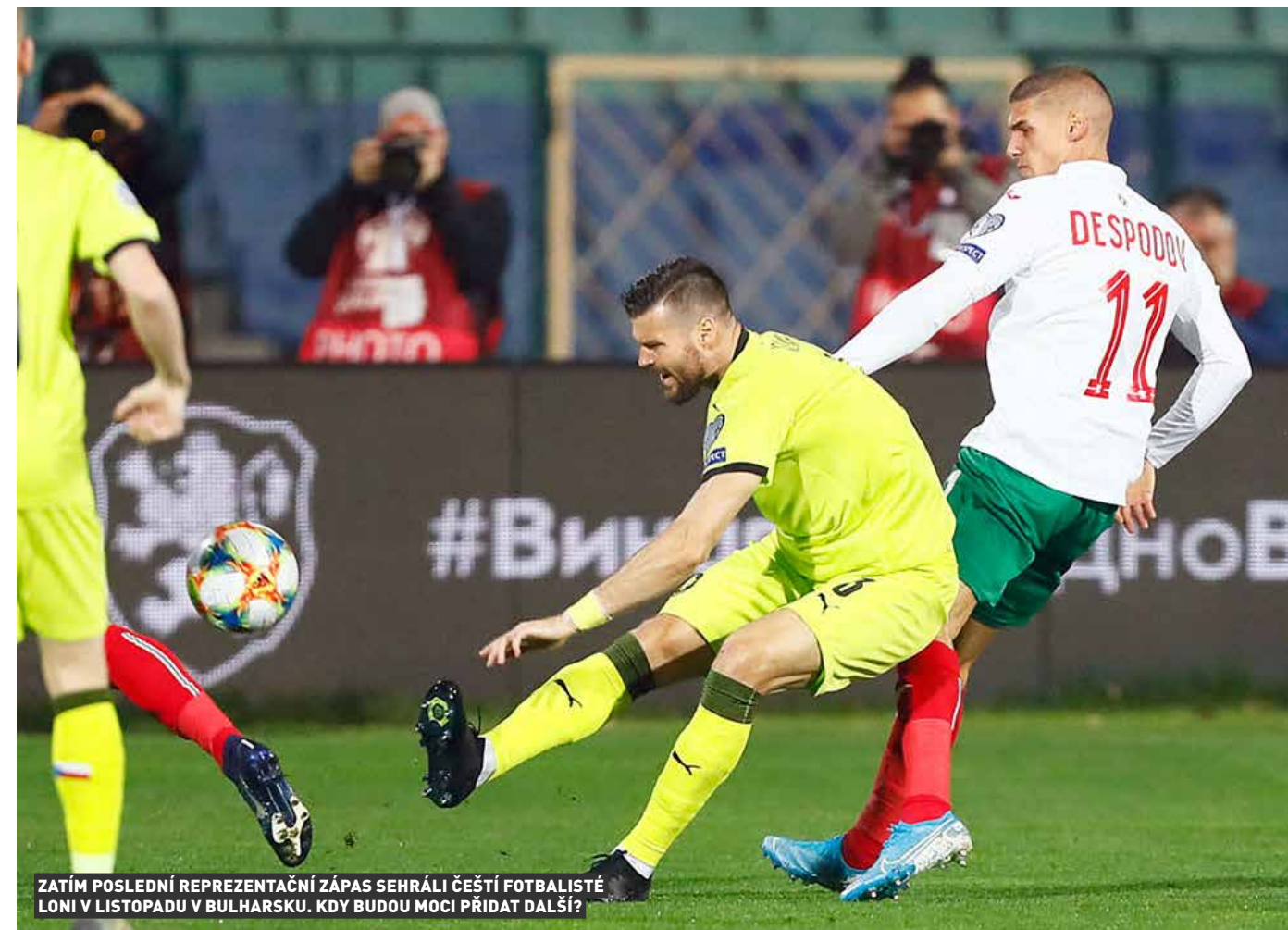
ZATÍM POSLEDNÍ REPREZENTAČNÍ ZÁPAS SEHRÁLI ČEŠTÍ FOTBALISTÉ LONI V LISTOPADU V BULHARSKU. KDY BUDOU MOCI PŘIDAT DALŠÍ?

UEFA odložila kvůli pandemii nového typu koronaviru všechny červnové mezinárodní zápasy. Hrát se mimo jiné mělo play off o postup na EURO 2020, které bylo už dříve přesunuté na příští rok. Většina národních týmů včetně české reprezentace dosud neměla na červen určené konkrétní soupeře.