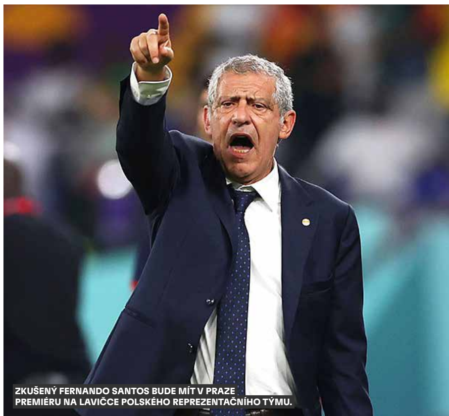
ZKUŠENÝ FERNANDO SANTOS BUDE MÍT V PRAZE PREMIÉRU NA LAVIČCE POLSKÉHO REPREZENTAČNÍHO TÝMU.

Nová kvalifikace o postup na EURO 2024 v Německu se z českého pohledu rozjede v pátek večer na stadionu v Edenu, kde národní tým přivítá největšího favorita skupiny E Polsko. A protože samostatná reprezentace od roku 1996 ani jednou nechyběla na kontinentálním turnaji, je jasné, jakou váhu oba soupeři vstupnímu kroku přisuzují.