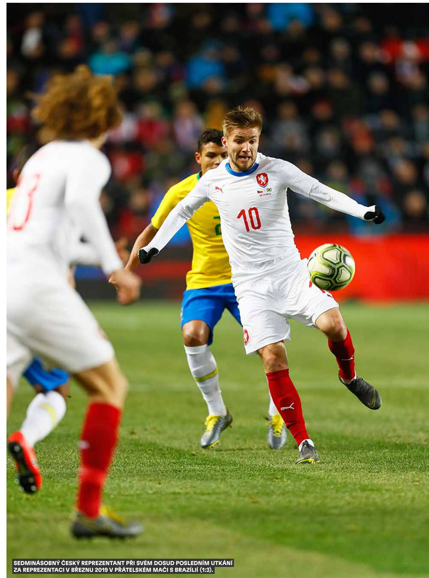
SEDMINÁSOBNÝ ČESKÝ REPREZENTANT PŘI SVÉM DOSUD POSLEDNÍM UTKÁNÍ ZA REPREZENTACI V BRÉZNU 2019 V PŘÁTELSKÉM MAČI S BRAZÍLIÍ (1:3).