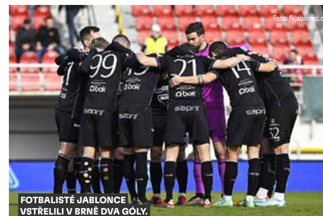
FOTBALISTÉ JABLONCE VSTŘELILI V BRNĚ DVA GÓLY.

Fotbalisté Pardubic dlouho zametali na úplném chvostě prvoligové tabulky, odkud už v posledních kolech šplhají výš. V soutěži gólové efektivity na tom byli Východočeši ještě hůř. Zlepšená střelecká potence jim přináší body a aktuálně už atakují průměr jedné branky na zápas, neboť ve veledůležitém záchranářském duelu doma s Teplicemi zaznamenali tři góly, které zajistily životadárné vítězství.