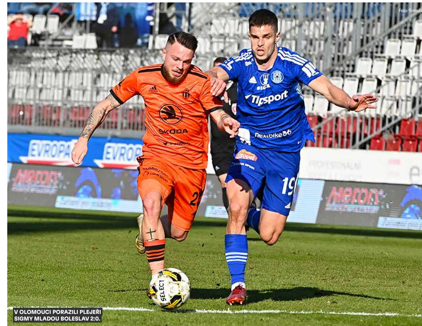
V OLOMOUCI PORAZILI PLEJEŘI SIGMY MLADOU BOLESLAV 2:0.