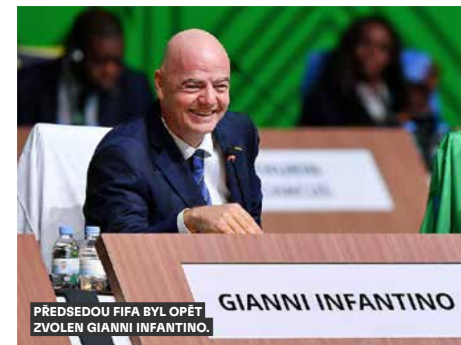
PŘESEDOU FIFA BYL OPĚT ZVOLEN GIANNI INFANTINO.