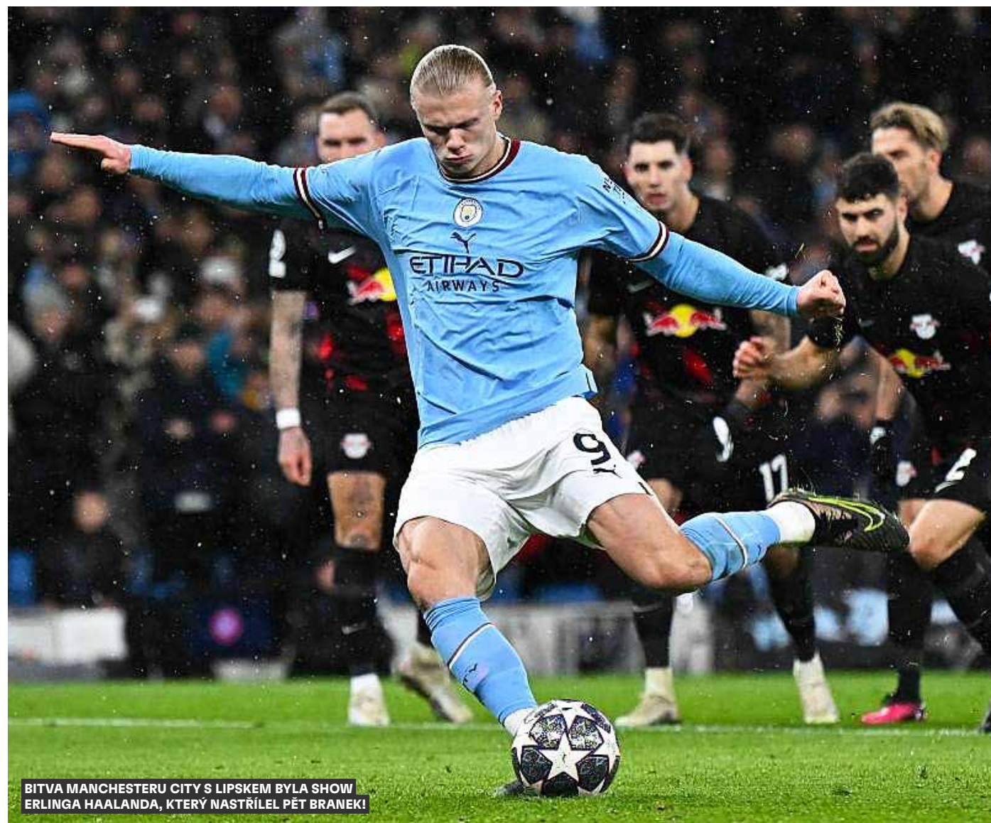
BITVA MANCHESTERU CITY S LIPSKEM BYLA SHOW ERLINGA HAALANDA, KTERÝ NASTŘÍLEL PĚT BRANEK!

Nejlepší osmička letošního ročníku Ligy mistrů byla zkompletována. Mezi vyvolenými nechybí ambiciózní Manchester City, který si na Etihad Stadium smlsnul na Lipsku, jemuž Erling Haaland nastřílel pět gólů! Do čtvrtfinále prošly také milánský Inter s Neapolí, z kola ven naopak musel Liverpool, který v repríze loňského finále nestačil na Real Madrid.