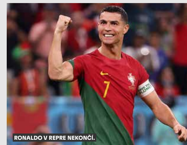
RONALDO V REPRE NEKONČÍ.

O první domácí zápas argentinských fotbalistů po jejich triumfu na mistrovství světa je obrovský zájem. O vstupenky na čtvrté přípravné utkání s Panamou v Buenos Aires žádalo podle agentury SID 1,5 milionu fanoušků. Do prodeje šlo 63.000 lístků v cenách od 57 do 240 dolarů (1300 až 5400 korun). Zápas byl okamžitě vyprodán, i když ceny vstupenek vyvolaly v zemi zmiňované hospodářskou krizí kritiku. Zbylých 20.000 míst na stadionu Monumental obsadí držitelé volných vstupenek. Podle šéfa argentinského fotbalu Claudia Tapii přišlo na svaz také 131.537 žádostí o novinářskou akreditaci. Na stadionu se přitom počítá s 344 žurnalisty. „Rádi bychom všem vyhověli, ale to bychom potřebovali dva stadiony jenom pro novináře,“ zdůrazňuje v nadsázce. Další přípravný duel čeká Lionel Messiho a spol. 28. března proti Curacau v Santiagu del Estero, lístky na tento zápas se teprve budou prodávat.