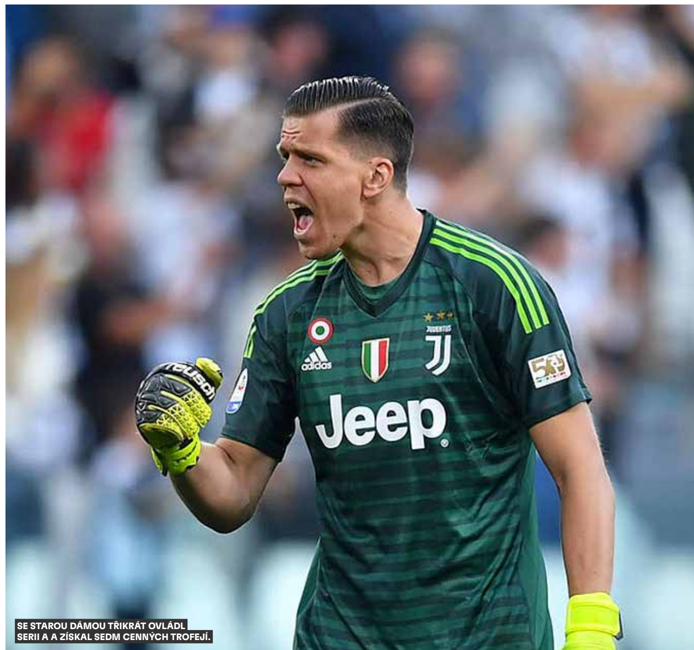
SE STAROU DÁMOU TŘIKRÁT OVLÁDL SERII A ZISKAL SEDM CENNÝCH TROFEJÍ.

obranu. Občas jej zradí jeho temperament, což vyústí ve žlutou či červenou kartu nebo zbytečnou chybu, s přibývajícím věkem však na této oblasti zapracoval a loni v létě se v rozhovoru pro Kanal Sportowy přiznal, že nerozumí tomu, proč se kluby více nezaměřují na psychiku a mentální stav svých hráčů. „Je zarážející, že v roce 2022 nemají profesionální kluby povinné mentální tréninky pro hráče. Zeptejte se jakéhokoliv fotbalisty a poví vám, že tak sedmdesát procent výkonu dělá hlava. Přesto je sto procent všech povinných tréninků fyzických. V klubech jsou psychologové a hráči mohou využít jejich služeb, pokud chtějí, ale povinný mentální trénink neexistuje. A měl by být zejména v situacích, kdy je vše v pořádku. K psychologovi byste neměli chodit jen tehdy, když už je zle. Když hledáte poznatky o své hlavě až ve chvíli, kdy je vaše psychika rozbitá, je těžší