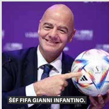
ŠÉF FIFA GIANNI INFANTINO.

Na mistrovství světa v roce 2026, kterého se v USA, Kanadě a Mexiku poprvé zúčastní 48 týmů, se odehraje 104 zápasů. To je o 40 utkání víc než na posledním šampionátu v Kataru. FIFA schválila na zasedání v Kigali úpravu formátu závěrečného turnaje, který se protáhne na 40 dní.