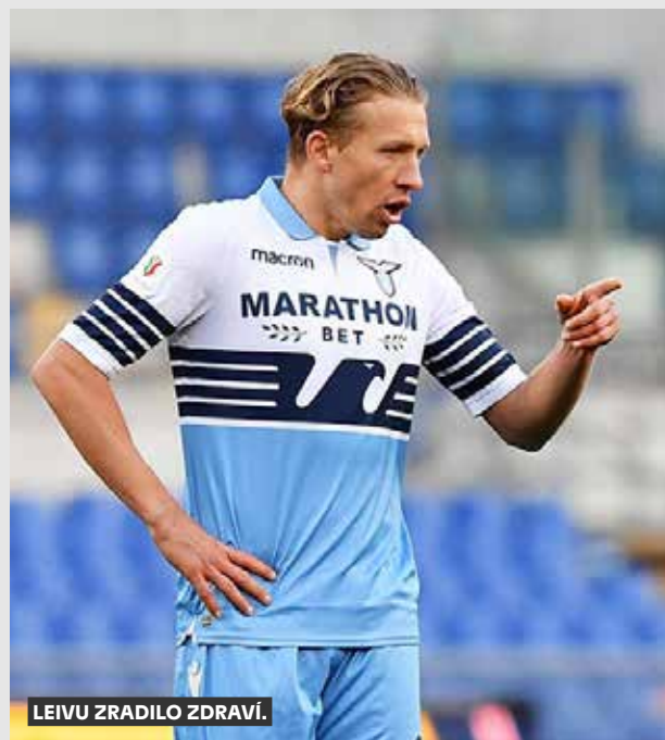
LEIVU ZRADILO ZDRAVÍ.

Bývalý záložník Liverpoolu nebo Lazia Řím Lucas Leiva ukončil kariéru. Důvodem jsou srdeční potíže šestatřicetiletého brazilského fotbalisty. Informovala o tom agentura Reuters. S kariérou se rozloučil v dresu mateřského Grémia, kam se loni vrátil po 15 letech v Evropě. Od prosince ale nehrál poté, co mu při pravidelné prohlídce lékaři zjistili problémy se srdcem. „Končím tam, kde jsem chtěl, ale ne tak, jak jsem chtěl. Zdraví je ale na prvním místě,“ přiznává Leiva, který za Liverpool hrál v letech 2007 až 2017 a vyhrál s ním Ligový pohár a postoupil do finále Evropské ligy. S Laziem získal Italský pohár. Za Brazílii odehrál 23 utkání.