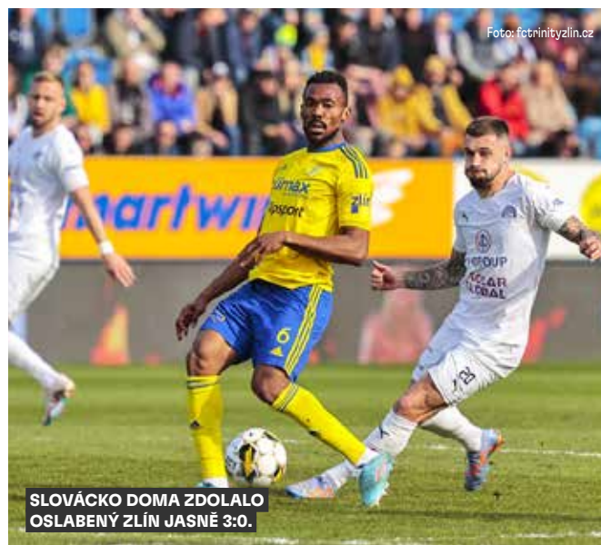
SLOVÁCKO DOMA ZDOLALO OSLABENÝ ZLÍN JASNĚ 3:0.