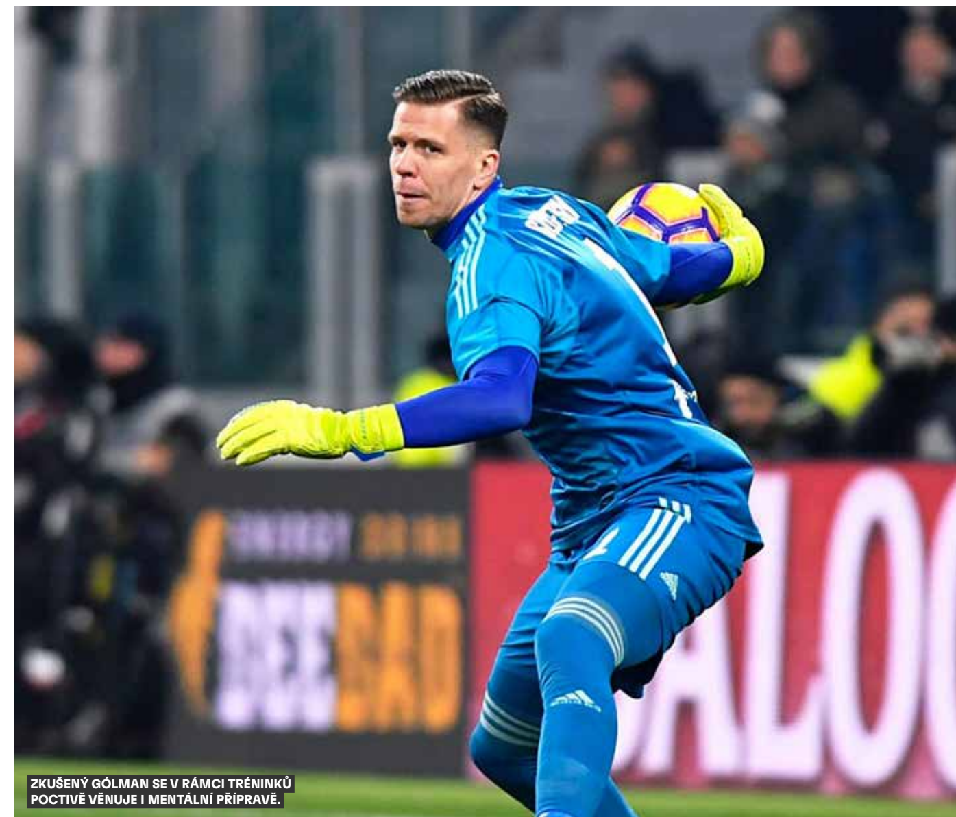
ZKUŠENÝ GÓLMAN SE V RÁMCI TRÉNINKŮ POCTIVĚ VĚNUJE I MENTÁLNÍ PŘÍPRAVĚ.

je získat, když už je situace špatná,“ uvedl Szczesny a odhalil, že se stále potýká s následky vážného zranění, které utrpěl jako teenager v posilovně Arsenalu, kdy si zlomil obě předloktí. „Každý zákrok je pro mě bolestivý. Moc o tom nemluví, protože jsem si na to zvykl. Kdybych si nechal z rukou odstranit kovové destičky, mohlo by to pomoci, ale rekonvalescence by trvala několik měsíců. Našel jsem řešení s rukavicemi, které trochu pomáhá, ale před rokem 2018 jsem zažil situace, kdy byla bolest tak velká, že jsem si po tréninku nemohl sundat rukavice ani otevřít láhev s vodou.“