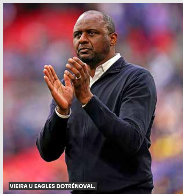
VIEIRA U EAGLES DOTRÉNOVAL.