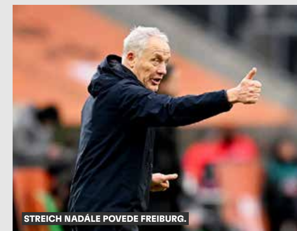
STREICH NADÁLE POVEDE FREIBURG.