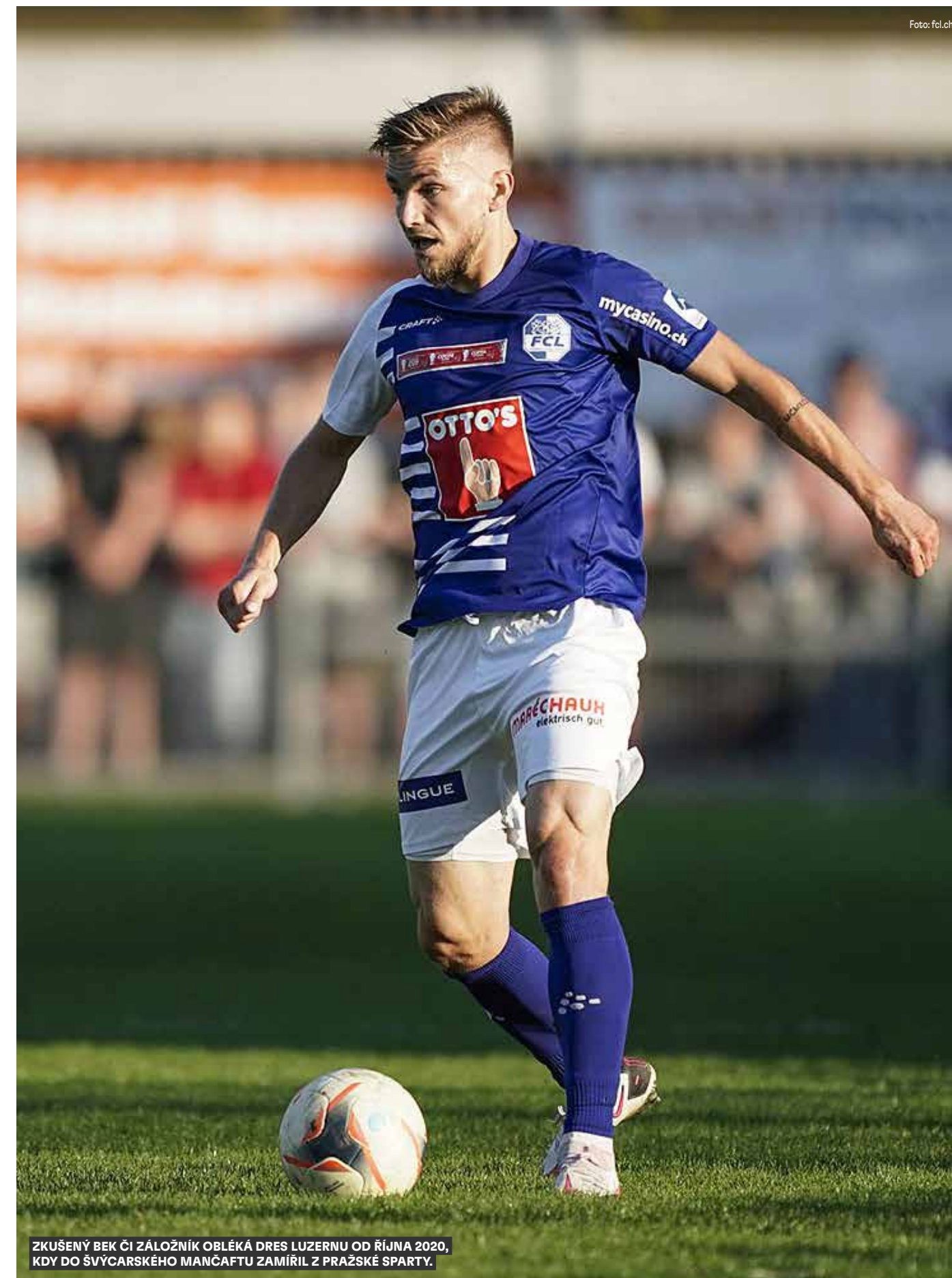
ZKUŠENÝ BEK ČI ZÁLOŽNÍK OBLÉKÁ DRES LUZERNU OD ŘÍJNA 2020, KDY DO ŠVÝCARSKÉHO MANČAFTU ZAMÍŘIL Z PRAŽSKÉ SPARTY.