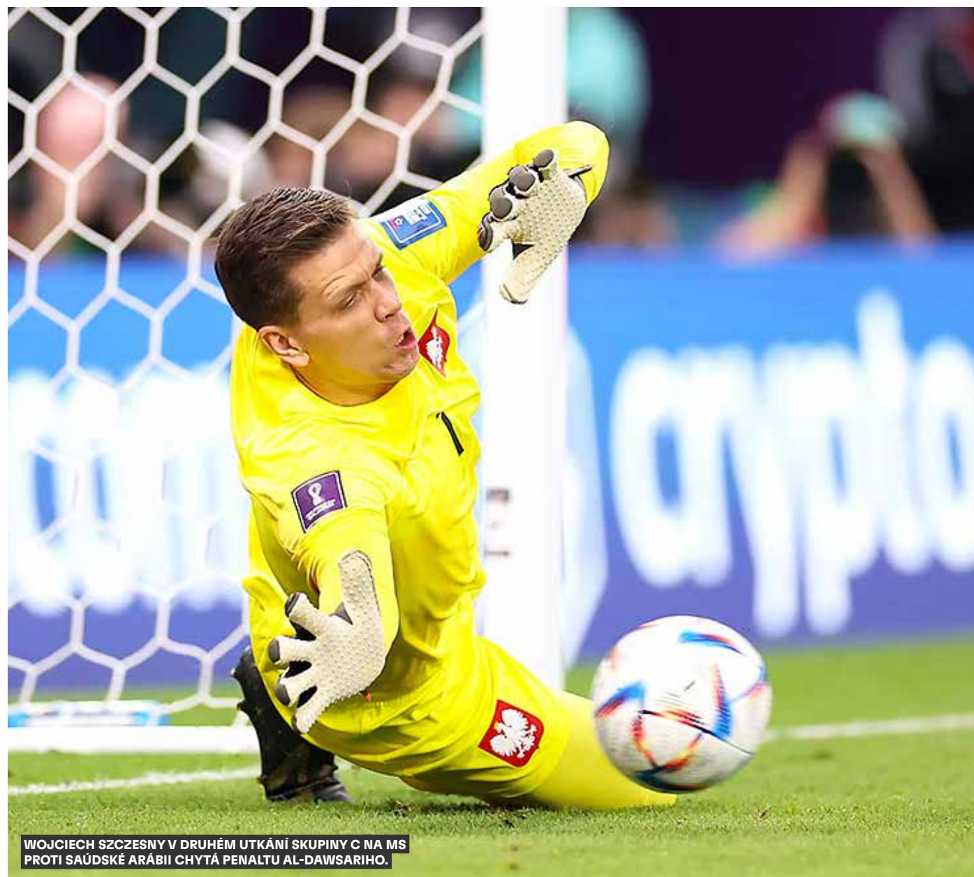
WOJCIECH SZCZESNY V DRUHÉM UTKÁNÍ SKUPINY C NA MS PROTI SAÚDSKÉ ARÁBII CHYTÁ PENALTU AL-DAWSARIHO.

Na dosud posledním, loňském světovém šampionátu, který v listopadu a prosinci hostil Katar, měl Szczesny výrazný podíl na tom, že Polsko postoupilo do osmifinále. V úvodním utkání skupiny C vycíhat plichtu s Mexikem (0:0) a následně se stal hlavním hrdinou druhého klání se Saúdskou Arábií (2:0). Poláci v něm šli do vedení zásluhou gólu Zielinského, ovšem Saúďové mohli v nastavení prvního poločasu vyrovnat. Jenže penaltu Al-Dawsariho i následnou dorážku Al-Breika fantastickými zákroky zneškodnil právě Szczesny a dal svému týmu šanci na výhru, kterou po změně stran zpečetil Lewandowski. V závěrečném skupinovém klání proti pozdějším šampionům z Argentiny (0:2) poté zneškodnil další penaltu hvězdnému Lionelimu Messimu a po Janu Tomaszewském a Bradu Friedelovi se stal teprve třetím brankářem, který na MS dokázal zneškodnit dva pokutové kopy. Prá-