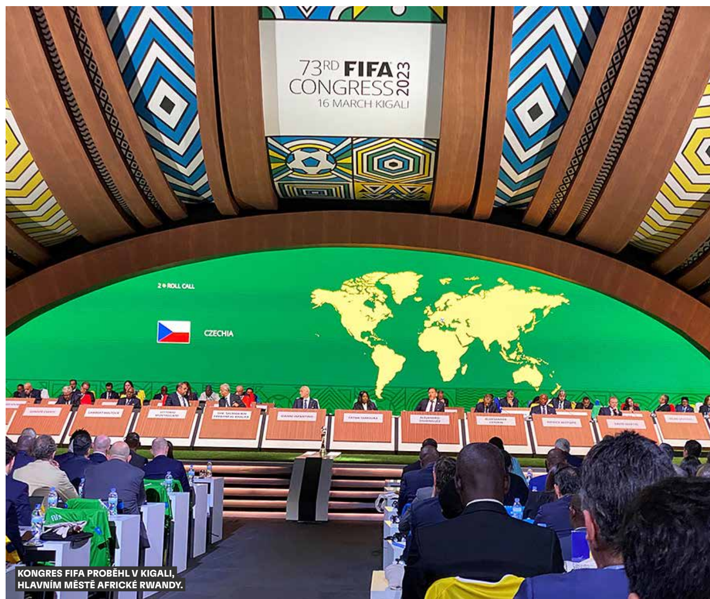
KONGRES FIFA PROBĚHL V KIGALI, HLAVNÍM MĚSTĚ AFRICKÉ RWANDY.