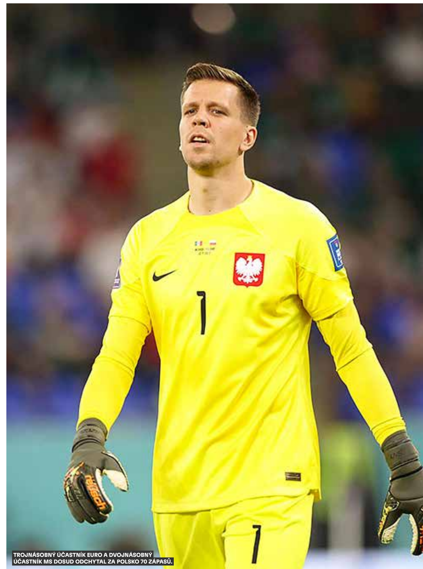
TROJNÁSOBNÝ ÚČASTNÍK EURO A DVOJNÁSOBNÝ ÚČASTNÍK MS DOSUD ODCHYTAL ZA POLSKO 70 ZÁPASŮ.