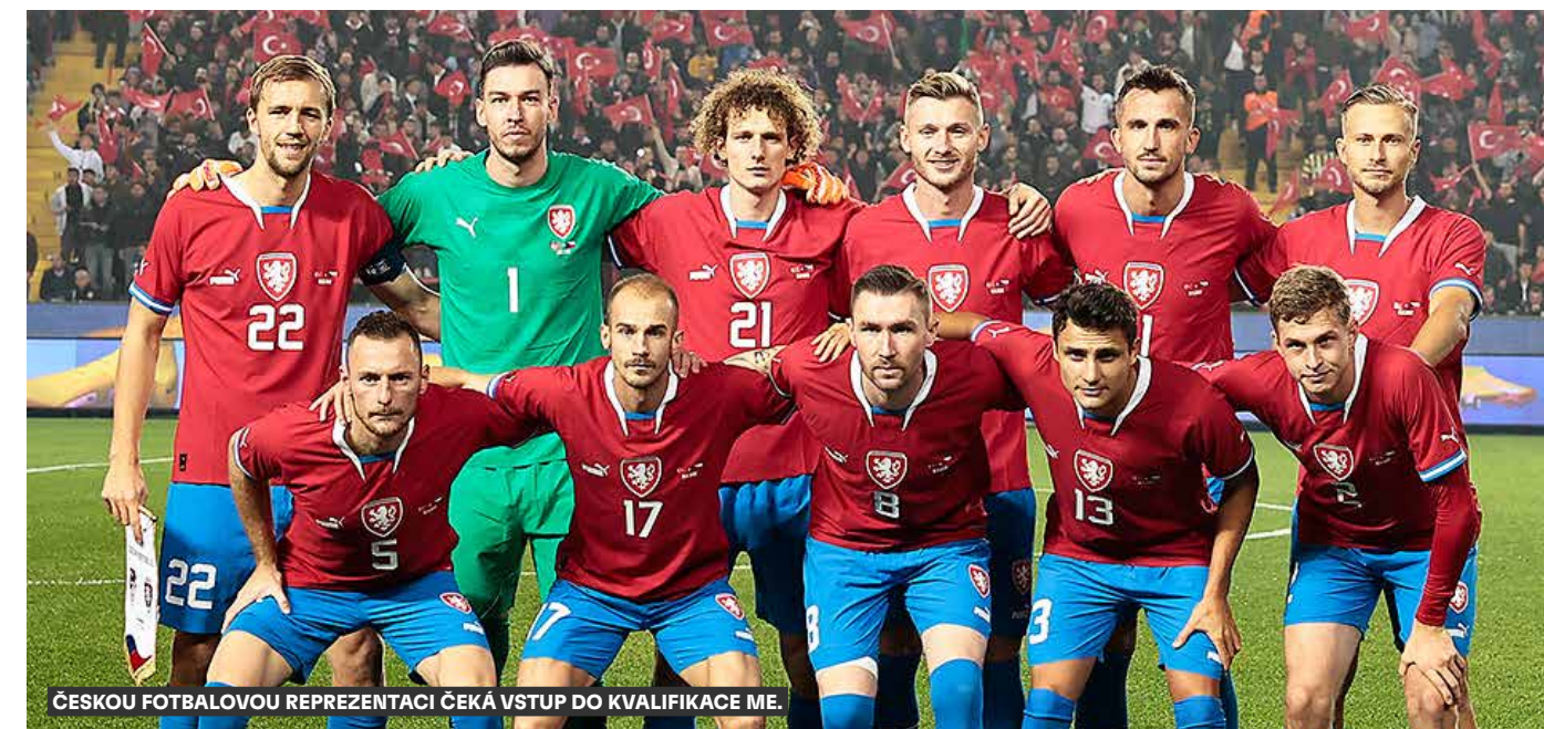
ČESKOU FOTBALOVOU REPREZENTACI ČEKÁ VSTUP DO KVALIFIKACE ME.