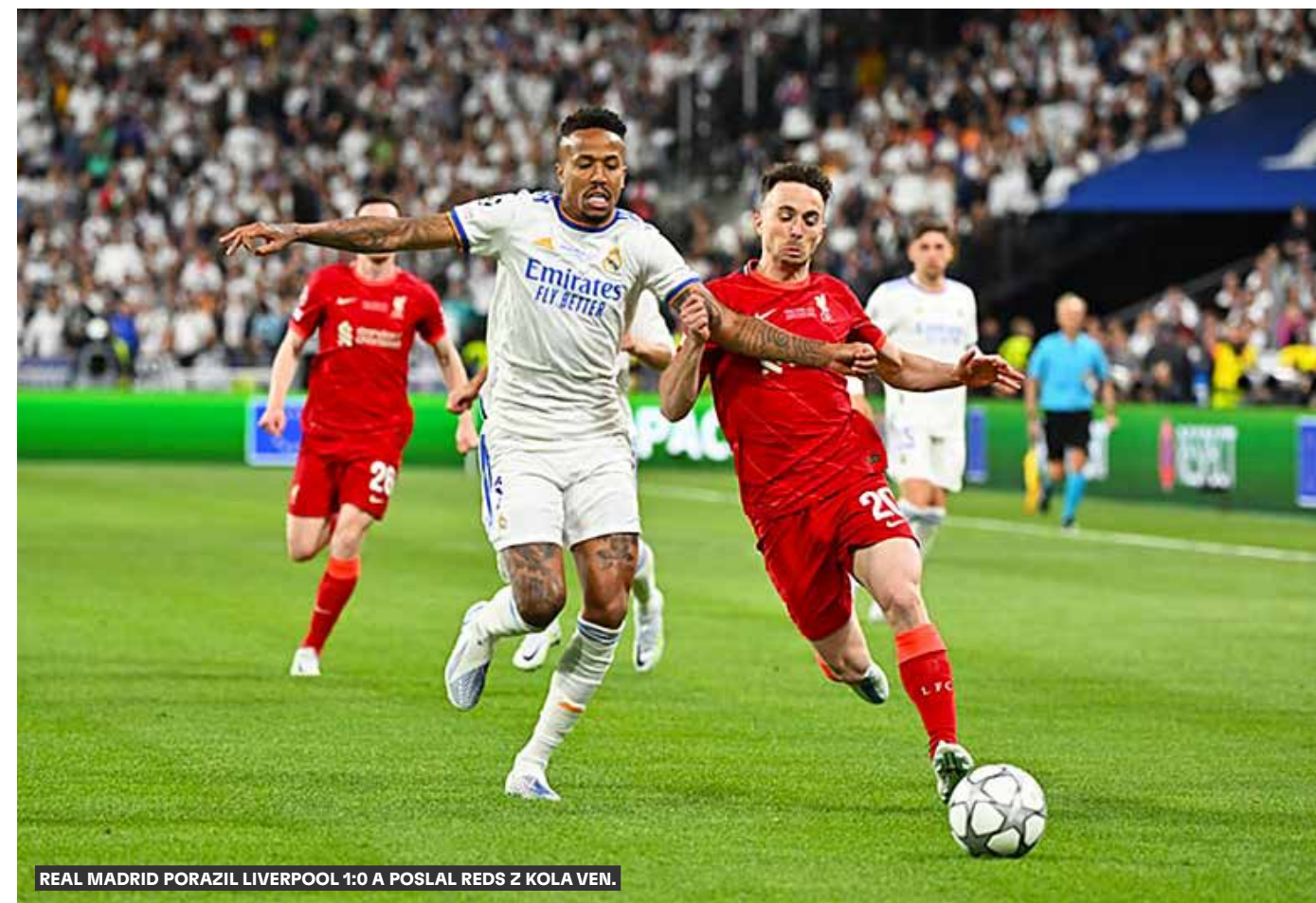
REAL MADRID PORAZIL LIVERPOOL 1:0 A POSLAL REDS Z KOLA VEN.

Nejlepší osmička letošního ročníku Ligy mistrů byla zkompletována. Mezi vyvolenými nechybí ambiciózní Manchester City, který si na Etihad Stadium smlsnul na Lipsku, jemuž Erling Haaland nastřílel pět gólů! Do čtvrtfinále prošly také milánský Inter s Neapolí, z kola ven naopak musel Liverpool, který v repríze loňského finále nestačil na Real Madrid.